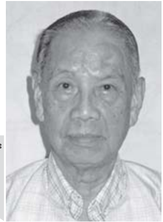
ဦးရွှေအုန်း

ဂျန်နဝါရီလ ၄ ရက် ၅၉ နှစ်မြောက် လွတ်လပ်ရေးနေ့ အတွက် အသက်ပေးဆပ်သွားခဲ့ကြသော မျိုးချစ်ခေါင်းဆောင်များ အားလုံးကို အမှတ်တရ ဖြစ်စေရုံမက ၎င်းတို့မျှော်မှန်းခဲ့သော လွတ်လပ်သည့် ပြည်ထောင်စု နိုင်ငံပုံစံအတိုင်းဖြစ်မလာခဲ့ခြင်းအပေါ် စိတ်မကောင်းဖြစ်ကြောင်း၊ သျှမ်းပြည်ဝါရင့်နိုင်ငံရေးသမားတစ်ဦး ဖြစ်သူ ဦးရွှေအုန်းက လက်ရှိအုပ်ချုပ်နေ သောစစ်အစိုးရအား ခေတ်မှီ တိုးတက်သော ပြည်ထောင်စုနိုင်ငံတော် အဖြစ်ပြုပြင်ပြောင်းလဲ နိုင်ရန် မည်သို့လုပ်ဆောင်သွားသင့်ကြောင်း ၎င်း၏အမြင်နှင့် သုံးသပ်ချက်ကို အကြံပြုပြောဆိုခဲ့သည်။