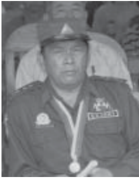
လင်းဂံး, ဗျာ

ကိုင်ဆိုင်လိင်, ခပ်, လူမ်းဂိုတ်းသိုက်းပွတ်းရွှင်, ပွင်, မားလွင်; သိုက်းမာမ်းသိုပ်, မိပ်, ဝိမ်းဆိုင် လူမ်းတံးဂိုတ်းသိုက်း SSA-N တေရှူးဝါးခိုင်; ဂးကမ်း, လံးကမ်း, လူးဆန်းစလ; ငဝ်းလံးယမ်းလိင် တူက်းထိုင်တၢင်းစဖေ တျ, ငဝ်းဂုမ်းသိုင်ဂိုတ်းယဝ်း။