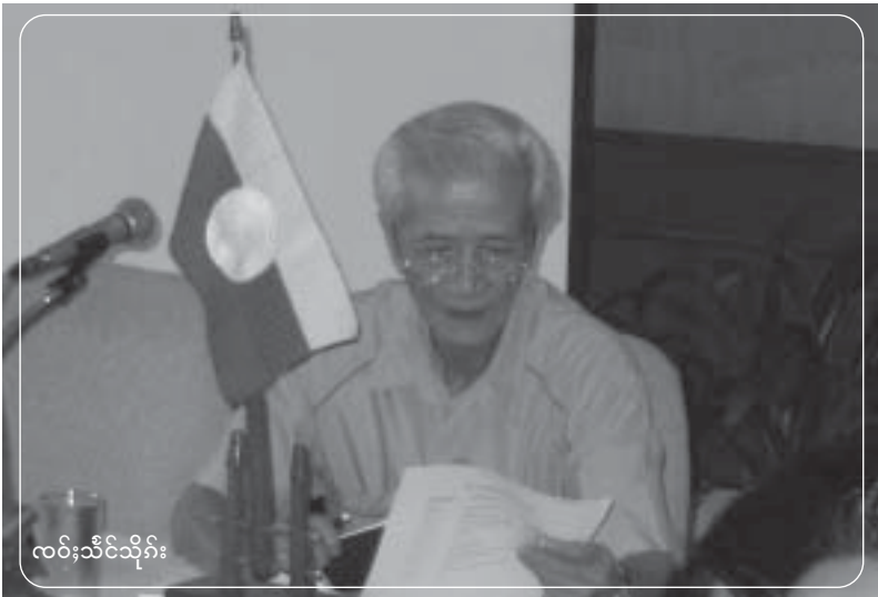
လင်းသီင်သိုဂ်း