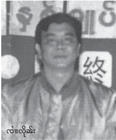
လုံးလုံး

လုံးလုံးသိုက်မိုင်းလေး ကဆွေကောင်၊ ဝေး တပ်သိုက်ကုန်းလီ တီ၊ မူဝ်၊ စတေးသီ၊ လိုဝ်၊ လာတ်မိုင်းတံးပွတ်းကွက်၊ (National Democratic Alliance Army Eastern Shan State NDAA-ESS) ထုတ်သိုက်မာအ်း စလး စစ၊ ဂမ်ဂိအ်း/မိပ်၊ ငိအ်း၊ တိုက်ကွဲ၊ ဝါးမိုင်း၊ တတ်း ဖွဲးဖွဲးပိတ်း။