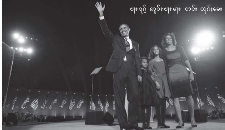
ဗားရက်် ဣင်းဗားမား တင်း လုဂ်; မေး

ဣင်းဗားမား ဣတ်, တီးပိင်း ရှပ်ဆဲလှိုင် လူးလူး ဆဲးလေးမိုင်းဂူဆဲးရှပ်ဝါး။ ပေးပိမ်း လက်းစိမ်းယုး။ စမ့ပိမ်းလက်းကမေးဒိုဗိုင်း။ မိုင်းကျ, ယု လ်း 6 ဗွင်, ဂျေ. ပိမ်းစမ့ဂူဂ်း စတေ့, ဆူးရှိုင်းမွှ်, လွှမ်း လက်းကိမ်းထုဂ်ဆဲး သျှိုင်စ လေး; မံ. ဂျေ. ယု, တီး ဂျူးဗားတေ့ မိုင်း ကိမ်းထုဂ်ဆဲးသျှိုင်စ လွှမ်းစမ့စလေး; ပေး သိုဝ်, မာဂ်းတင်းရှိုင်း 4 ပီ။ ဣင်းဗားမား ရှိုဆဲး ယဝ်လဆဲလွှမ်း ဗွင်လမ်းစီးယိုင်း စလေး; ဗူး, ပံးမံမီးတီးလဆဲလွှမ်း ရှပ်ပိုင်း။ ယမ်းရှိုတ်း ဂါဆဲပိမ်းဗူးလက်းဂါဆဲတူင်, ပိုင်းဂူဆဲး။ ဗူးသွဆဲ လဆဲလွှမ်း စလေး; ဗူးတင်ဆူးသုဆဲး, လ်းဂူဆဲးမိုင်း မူးသေ လင်, မူးသုဆဲလက်းဂါဆဲမိုင်း။ မဆဲးလင်း; လ်းရှပ်, ဣတ်တမ်းရှိုင်းပိမ်း ဗူးတိမ်းသဗေး ဝူဆဲ မိုင်းကိမ်းလိဆဲး ဆဲးပီ 1997 ထိုင် 2004 ။ ယမ်းရှပ်လှိုင်; ပိမ်း ဗူးတိမ်းသဗေး ဂူဆဲးမိုင်းကမေးဒိုဗိုင်းဆဲးဂါဆဲလှိုင်; တင်း; (မိုင်း ပင်လှိုင်; တင်း) ပီ 2000 ။ ဂူလှိုင်; ဂျာနမ်, ပေ. ဂါဆဲလှိုင်; တင်း။ လင်, ရှပ်လှိုင်; ပိမ်းဗူးတိမ်း သဗေးဝူဆဲ ကမေးဒိုဗိုင်းသေ စတေ့, ရှာသီင်မူး တင်း; စတေ့, ပီ 2003 ။