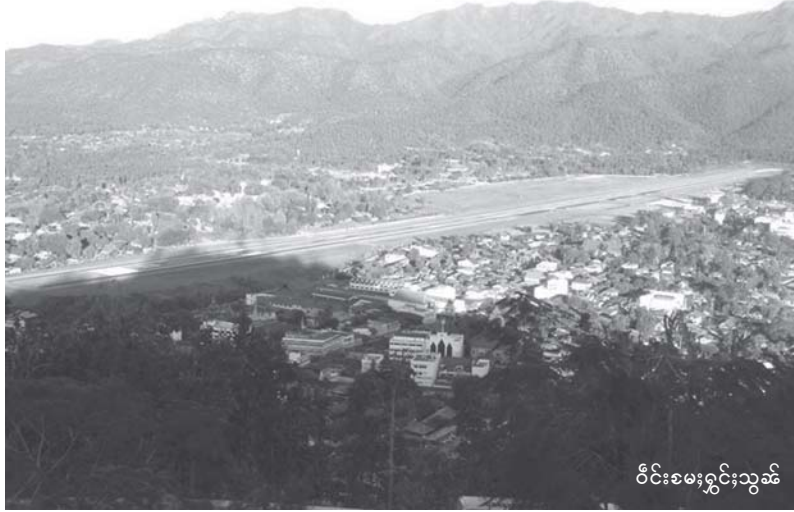
ဝိုင်းစမးရှင်းသွမ်