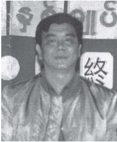
လပ်၊လံးလီဆဲး ရှပ်ပပ်၊လူင်လုမ်းမိုင်းလေး

လုမ်းမိုင်းလေးဆွဲ ပီဆဲလုမ်းရှုလ်းလီဂဆဲ တင်း တပ်သိုက်မိုင်းဝါး-ဖွဲ့မိုင်း (UWSA) တင်း လုမ်းဂုမ်းဂင်၊ လှိုင်းပက်၊ယိပ်းဂုမ်း လီဆဲလီဆဲစမ၊ မိုင်းစတ၊ဝါး၊တေကပ်ဂဆဲးဝါး