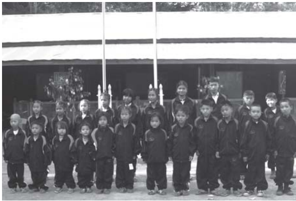
ပါင်ပွံးဂှပ်တွခ်း; ပီမ့်, တံး 2103 စလ; ပါင်; ပိုတ်, ဂှင်; ဂှိတ်း; လိုင်; လတ်; ဝါခ်း; ဂှင်; မိုင်း; မိုင်း; ဆေး; လိခ်း; သိုင်း; မံ 6 တပု; သိုင်း; လိုင်; တံး