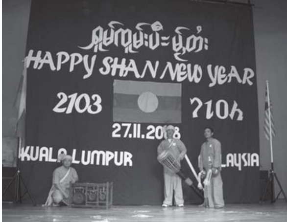
ပါင်ပွံးဂှပ်တွခ်း; ပီမ့်, တံး; မိုင်း; မလေးသျှိုင်း

ပါင်ပွံးဂှပ်တွခ်း; ပီမ့်, တံး; ဆီး; ကိတ်ဆိုင်; ဝါခ်းလံး; လံး; လိုင်; လံး; ပိုင် တံး; ဖှင်; တမ်; မခ်း; လိုခ်း, ဖှင်; တံး; ဖှင်; ဝါခ်း; ယုင်; သေ ကွခ်းကမ်; စတ်; လိုင်; ဝါခ်း; မိတ်, မး; တေး; ထိုင်; ပီတံး 2103 ဆီး; ဆီး; ဝါခ်း; လိုခ်း; မိုင်း; ဆေး; ဂေး; ဂှု. တမ်း; တေ; သိုပ်, တမ်; ဂှု, ကမ်, ဂှင်။ ပါခ်း; သိုင်း; မါခ်း; ပီခ်း; ယု, ဆီး; မါင်; ပီဂေး; ပခ်း; ကဆုဂှတ်; သေ; လိုင်; ဂှိတ်း။ မါင်; ပီဂေး; ဝု; ဖှး; ဂွမ်း; တိုင်း; လိုင်; ဂှိတ်း။ ပေး; ဂှိတ်း; ပွံး; ယင်; သမ်; မတ်; မတ်; ဂေး; ဂမ်; ကမ်; ပွင်; ပီခ်း; ပါင်; ပွံး; ဂေး; ယမ်း; မီး။ မိုခ်း; ဆင်; ဆီး; လိုင်; ထ်; ဂေး; လံး; လတ်; ဂှိတ်း; ဝါခ်း; တံး; လွမ်း; လိခ်း လိခ်း မိုခ်း; လိုင်; ဆင်, ဝါခ်း; လင်း; တိုင်, ကိုင်, ဝါခ်း; လိုင်; ဝါခ်း; လေး; တွခ်း; ဂိတ်း; မံ, ဝါခ်း; ဂှိတ်း; တံး, (ထိုတ်; ထ်) ကိုင်, စမ်; ဖှာ. လိုင်; ဝါခ်း; ဂိတ်း; ဂှိတ်း။ လွမ်း; ဝါခ်း; လိုင်; မိုခ်း; ဆင်, ဂိတ်း; မံ, ပီခ်း; ဂေး; ဂှိတ်း; ပီခ်း; ပါင်; ပွံး; လိုင်, လိုင်