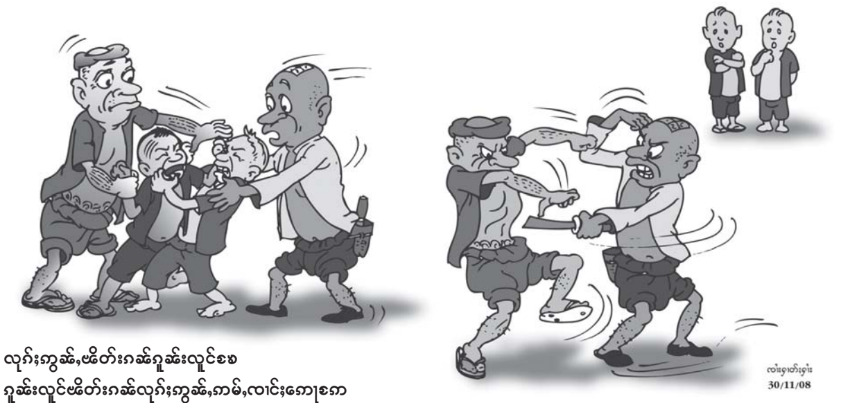
လုနီးကွမ်း၊ ဖေတ်းဂမ်ဂူဆင်းလူင်စစ ဂူဆင်းလူင်ဖေတ်းဂမ်လုနီးကွမ်း၊ ကမ်၊ လင်းဂေးစက