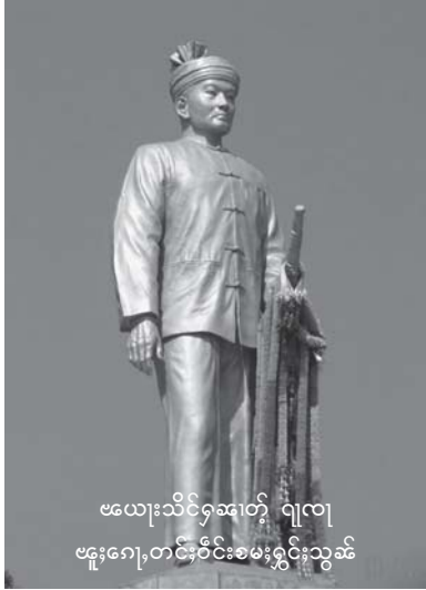
ဇေယျာသိင်္ဂဆတ်၊ ဂျုလု ဗုဒ္ဓဂေ့၊ တင်းဝိုင်းစမးရှင်းသွမ်