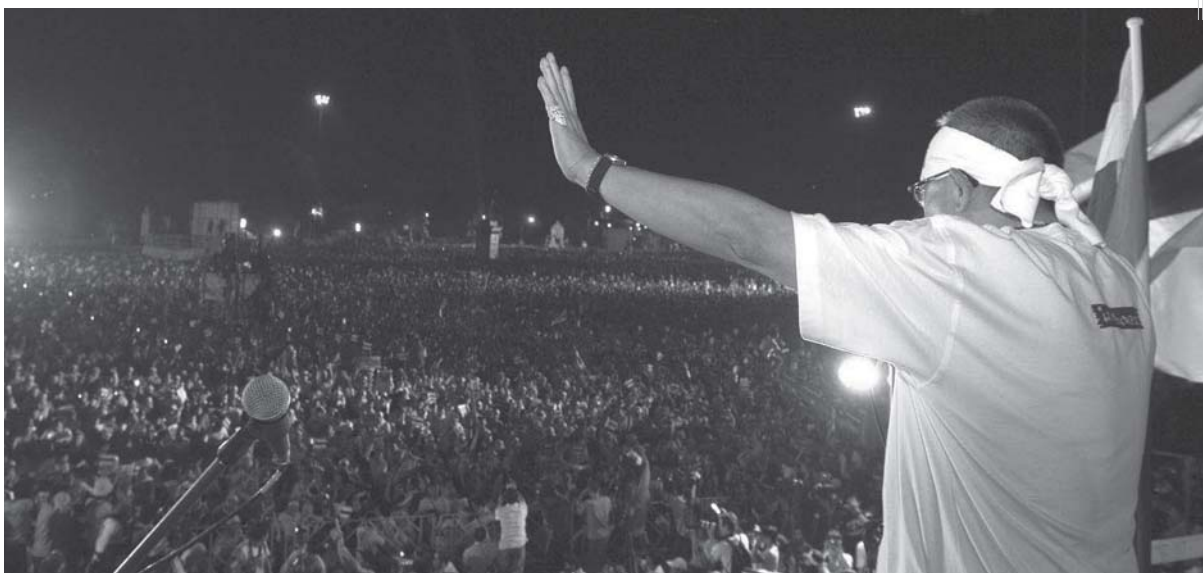
ဖျာ,ရှိုင်းဆင်ပိုင်း,သိမ် လှိုင်းရှိုင်း,စခန်းကိန်းရှိုင်းသားစတီးလှိုင်ပွင်လှိုင်;