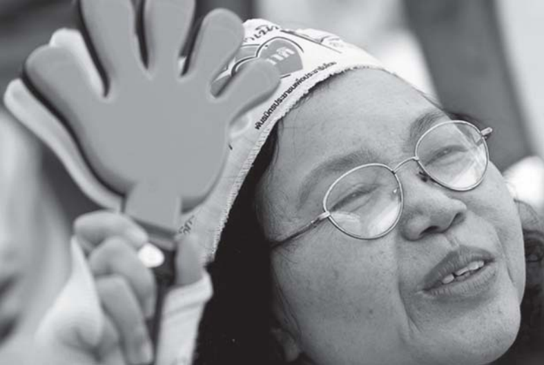
ဖျာ,သိုင်းလှိုင် (PAD) တူင်းတိုင်း,လှိုင်း,ရှိုင်း, စခန်းကိန်းရှိုင်းသားစတီးလှိုင်ပွင်လှိုင်;

ဝခမ်းထိ 7 ကွန်းထုင်းပိုင်းပူဆွဲများ ကိင် ဆိုင်ပလိန်းထံးရှမ်းတပ်စတီးစွင်လှိုင်းသိုင်းလှိုင် ကခင်းရှိုင်းတုဒ် ဖြန့်,အခမ်းထိမိတ် (ရှမ်းတုမ်ကူလှိုင်း လိဂူဆေးမိုင်း ပိုင်းတုဒ်တီးစွန်းစရေးသီးPAD) သေ ပွဲ,ကိတ်သိဆွဲတုဒ် ထိုင်းရှိုင်းမာ်,တိန်း,သို့, စလေး လံးလှိုင်းတံာ် 2 ဂေး။ မာတ်,လိမ်းဆင်ရှုပ် ပာ်,- ကပ်ပီဆိစာပ်,ယို,လှိုင်းလင်လှိုင်းဖျာ။ လင်းဆင်းရှေးစမ်း လံးဂွန်းစမ်းရှိုင်းပင်လှိုင်း ဝခမ်းသုင်,ပူဆွဲစာပ်,တူပ် ဆင်းယိုင်းဂေးလံး ထုင်းမာ်,တိန်း,ပလိန်းတိုင်းသေ တူန်းသုမ်းဆွဲ ပင်တူင်းတိုင်း,ဆခင်း လှိုင်းဂွမ်း,။