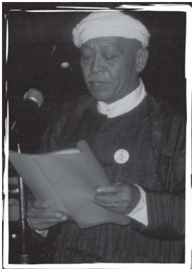
လင်းစုဆွေကျွန်း ရှိုက်၊မိုင်း 6/9/1925 ဝိးသေပူဆွေလင်းစုဆွေယဝ် လုံးတူင်ဆိုင်ကဆိမိုင်း စလး ဂဆိလိက်၊လုံးဖှာင်၊စစ၊ ဆန်းဝိင်းလူင် တူဆိးတီး၊ ရှမ်းဂဆိတင်း လုံးဂဆိးယွတ်း တင်း

လင်းစုဆွေကျွန်း ဝိဆန်းဝန်းလင်းစုဆိ ဂျှုဆု (လင်းသိင်သိုက်၊ ရှပ်ပပ်းပု၊တီး၊မိုး၊သုင် လိုင်းတံး SSPP၊ ရှပ်ပပ်းတုမ် တီးမွက်စစလေး သီးလိုင်းတံး SDU စလး ရှပ်ပပ်းဂေးစိဆိ၊တိမ်၊ ပိုင်ဝပ်းပိုင်းမိုင်းလိုင်းတံး SSCDC ) ဝိဆိလုက်၊ လုံးလင်းစုဆွေကျွန်းပု ဖွဲ့စည်းကဆုန်လင်းစုဆိ တံး ကဆိ ရှမ်းလင်းလုံးမိုင်း ဆန်းလိက်၊ရှမ်းမံးပင်လူင် တင်း လပ်းဖှာ၊စပ်းလပ်း၊ မိုင်းဝိ 1947 စလး ဝိဆိ ဖွဲ့စည်းလူင်ဖှာ၊ဖှာဂ၊သွမ်းဆန်းလူင်ပွင်လိုင်း လေး မိုင်းတံး။