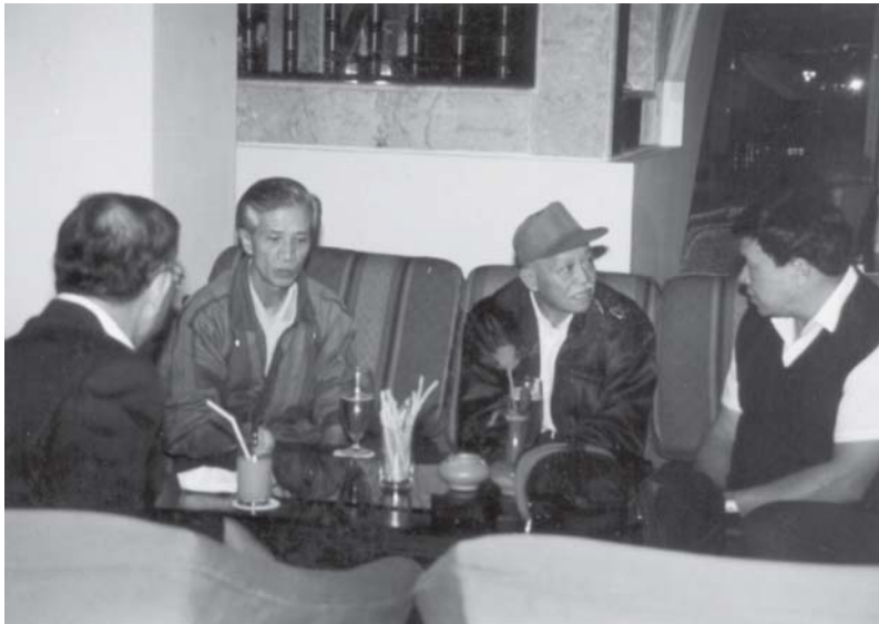
လင်းစုဆွေကျွန်းဆု စလး လင်းစုဆွေကျွန်း ရှပ်ထုပ်းကပ်းစိပ်း

ယမ်းစဆဂင်လှို ကဆိ၊ဂိဆိစပ်းစတီးတု၊ မိုင်းပလိက်ထံး လေးဝိင်းစမးသံ၊ (ဂိုင်းရှား) တေးမုးလိုပ်းလမ်းဂူဆန်းဝါဆိးလွင်ဖှာလပ်း ရှုံး စံးကွပ်းပိုဆိတီးဆဆစလး ရှိုက်ရှုံးဂူဆန်းဝါဆိး လွင်ဖှာလပ်း လုံးပူဆွေလွတ်းလွင်းတိုက်တိုင်မုး။ ဝိးလင်းစုဆွေကျွန်း သိမ်းပိုက်မှုယဝ်ဆဆ လုံးစမ်းရှာဆိဖှာ၊ လုံးသိုပ်းပုတ်းရှိုက်ဆးဂဆိ ဂဝ်ဝပ်သုခ်းလုံးဂူဆန်းထိုင်တံး (SHRF) မုး တေးထိုင်ယမ်းလိပ်။