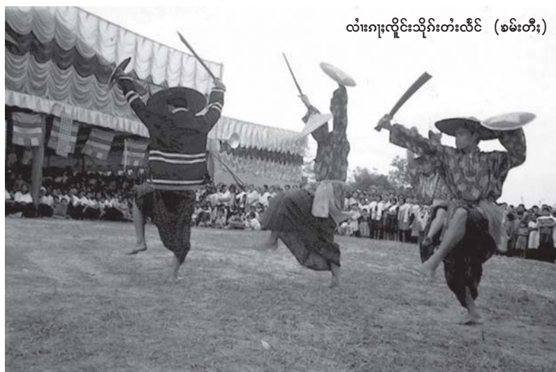
လံးဂေး၊လိုင်သိုက်၊တံးလီင် (ခမ်းတီး)