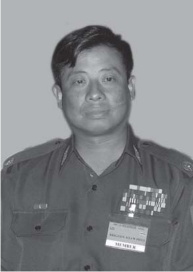
လွမ်ရှမ်းဂျေ့ဖ်ဇ်ဗ်း ဗဟိုဂွမ်းတိုင်းသိုက် သမ်လီင်, (ဂ်ဇ်တုင်) ဂျေ့ရှုလုံးပံးသူဆင်းတုမ် လုမ်းသိုက်ဝု.ပွတ်းတုးဆေးလိဆ်သိုက် 171

လိုင်းပန်းဆ်းလိုင်တံးပွတ်းကွက်, နှင်း တေ့, လီဆ်လိဆ်ထံး။ ဂျေ့ဂ်ဆ်စပ်းရှုမ်းမူ, တင်း လင်း ဆေးတီးသိုက်ဝု.သေတု. ကုပ်, ဂဆ်လွင်းသင် မီးစေးတံးတတ်းသင် တုန်းလွင်းဂဆ်သင် ဂဆ်စတုစတုပုံ, ရှု. ကဆ်ဆေးဆေးတိုင်းစတု လွင်းလိုက်တင်း; 2010 ၊ လွင်းရှိုတ်းပွဲ၊ လွင်း ရှုင်းဗွမ်းဗွမ်းစလး လွင်းတေပဆ် နိုင်းဗွမ်း တမ်းဆ်းရှုမ်းလိုင်ဆ်း- လီင်, ဗပ်, လီဆ်လိဆ် ပွင်, မးဆင်, ဆ်။