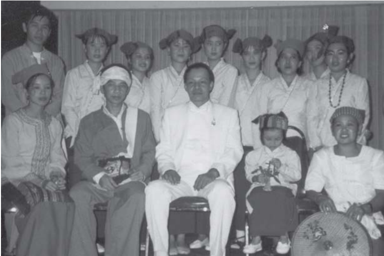
ပီးဆွင်တီး ဂျှုးယွဆ်းသျှုး ဝဆ်းရှိုတ်းလဝ်းယွတ်းအေ၊ တီးမိုင်းဂွဂ်း

ယွဆ်းတပ်းသိုဂ်းမာဆ်းတဆ်းရှုးတုင်စလး၊ ကဆ်း ယိုတ်းလံး၊ ထိုင်တီးမိုင်းထံးမိုင်းမာဆ်း၊ လံးပီဆ်း သျှုးပီဆ်းဂွမ်းလိစဆ်းဂဆ်းတင်းရှိုင်း။ တာင်း လဝ်းရှေးစမ်းဂေး၊ လံးရှုင်းမဆ်းလဝ်း၊ သေ ပဆ်း ဆေးကဆ်းဆ်းရှိုင်းဆ်းရှေးယျှုးဂျှုး တေးပေးသုတ်း မုဆ်း။