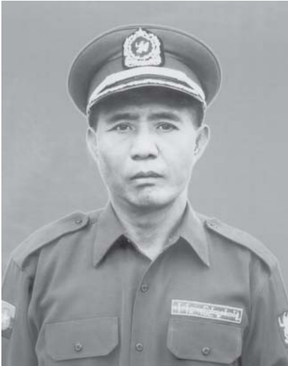
ပြည်သူ့စစ်ဗိုလ်မှူး

MTA ခွန်ဆာလူဟောင်း သျှမ်းပြည်မြောက်ပိုင်းမှ လူမှုထူးချွန်ဆုရ ပြည်သူ့စစ်ဗိုလ်မှူးအဖွဲ့ဝင်နှင့် နာမည်ကြီး ထိပ်တန်းသျှမ်း ရော့ခ် အဆိုတော်တစ်ဦး လားရှိုးမြို့အတွင်း ရာဘာစိတ်ကြွဆေးပြား ရောင်းဝယ်နေကြစဉ် နေပြည်တော်ပုလိပ်၏ဖမ်းဆီးခြင်းခံရကြောင်း သျှမ်းပြည်မြောက်ပိုင်းသတင်းရပ်ကွက်က ဆိုပါသည်။