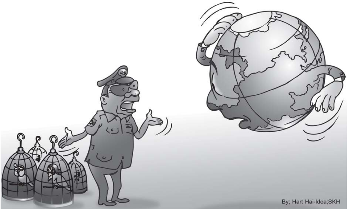
By: Hart Hai-Idea;SKH