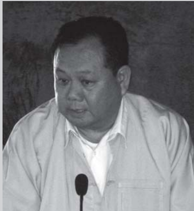
SNLD ဥက္ကဋ္ဌ စစ်ခွန်ထွန်းဦး