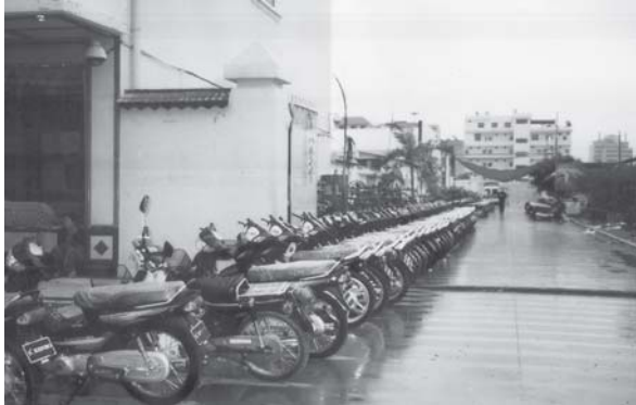
ဘယ်သူမှ မသိဘူး” ဟု၎င်းကပြော၏။

“ဒီလ ၈ ရက်နေ့က အမိန့် ထုတ်တာ။ တစ်ရက်ကို ဆိုင်ကယ် အစီး ၂၀၀ လျှောက်လွှာလက်ခံမယ်တဲ့။ ထိုင်းဆိုင်ကယ်၊ တရုတ် ဆိုင်ကယ်နဲ့ ဂျပန်ဒီထီဆိုင်ကယ် လိုင်စင်ကြေးမတူဘူး။ အခွန်ကြေး လည်း အင်ဂျင်ကြည့်ပြီး ဈေးနှုန်းသတ်မှတ်ကောက်တယ်။ ဒါတင်မက ဘူး မယကာကို ကျပ် ၃ ထောင်ကနေ ၆ ထောင်၊ စည်ပင်ကို ၃-၄ သောင်း ရုံပုံငွေထပ်ပေးရတယ်။ မသွင်းလို့မရဘူး။ နားကပ်မုန်တိုင်း ဒုက္ခသည် တွေထောက်ပံ့ဖို့ ကောက်တာလို့ ပြောတယ်။ တကယ်တုတ် မဟုတ်