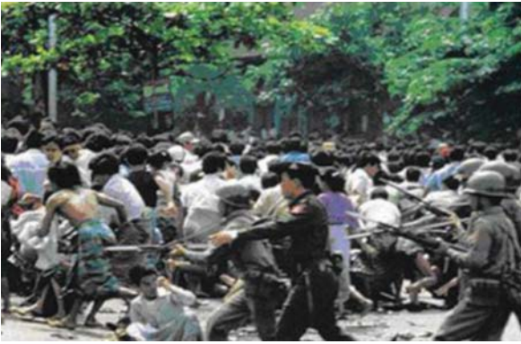
၈ လေးလုံး ဆန္ဒပြသူများအား စစ်အုပ်စုအကြမ်းဖက်နှိမ်နင်းပုံ

interest အတွက်ဖက်တွယ်လိုမှုသည်လည်း ယနေ့စည်းလုံးမှု၏ အနှောင့်အယှက်ဖြစ်သည်။