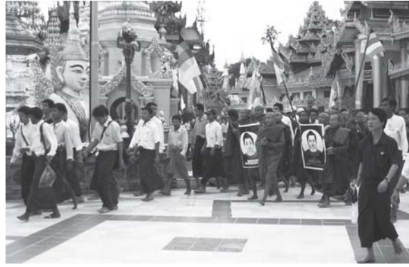
၂၀၀၇ ရွှေဝါရောင်တော်လှန်ရေး

တိုင်းရင်းသားအင်အားစုနှင့် ဒီမိုကရေစီအင်အားစုများ၏ ညီညွတ်ရေးလျော့ရဲမှုအပေါ် ရန်သူစစ်အုပ်စုက အသုံးချနေသည်ကို သိသိကြီးနှင့်ခိုင်မာစွာမစည်းလုံးနိုင်ကြခြင်းမှာ မိမိတို့၏ချို့ယွင်းအားနည်းချက်ကို မဆန်းစစ် မကုစား မဖယ်ထားနိုင်သောကြောင့်ဖြစ်၏။ ရန်သူတစ်စုအင်အားကြီးမားခိုင်မာလာစေရန်၊ ပိုမိုကြမ်းကြုတ်ရက်စက်လာစေရန်၊ ဥပဒေကြောင်းအရ အသာစီးပြင်ဆင်ခွင့်ရစေရန်၊ ထောက်ကူ ပံ့ပိုးသကဲ့သို့ဖြစ်သည်ဟု အတိုက်အခံခေါင်းဆောင်အချို့ကဆို၏။ စည်းလုံးမှုလျော့ရဲစေသောအနှောင့်အသွားများအနက် သဘောတရား (အပြော/အရေး) နှင့်လက်တွေ့မကိုက်ညီခြင်း၊