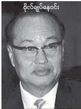
ဗိုလ်ချုပ်နေဝင်း

၈ လေးလုံးအရေးတော်ပုံ၊ ဒုတိယမိစ္ဆာစစ်တပ်အာဏာသိမ်းမှု အနှစ် ၂၀ နှင့် ၂၀၀၇ ရွှေဂါရောင်တော်လှန်ရေး နှစ်ပတ်လည်အခါ သမယဖြစ်သောကြောင့်ပင်။