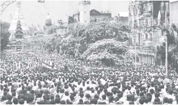
၁၉၈၈ ရှစ်လေးလုံးအရေးတော်ပုံ

စုများ မှုအရလက်ခံသဘောတူသည်ဟူသောအဆင့်၌သာမျှော်ထားဆဲ ဖြစ်ပြီး အခြားပြည်နယ်များနည်းတူ ဗမာပြည်နယ်ဖွဲ့ စည်းပုံ အခြေခံဥပဒေမူကြမ်း ရေးဆွဲရေးလုပ်ဆောင်မည့်သူ မရှိသေးသည်ကိုတွေ့ ရ၏။ ထို့အတူ NCUB လို ဒီမိုကရေစီမဟာမိတ်တပ်ပေါင်းစုနှင့် NCGUB လို အဝေးရောက်အမျိုးသားညွန့်ပေါင်းအစိုးရတို့တွင် ကချင်၊ ကရင်နီ၊ သျှမ်းပြည်အင်အားစုများ မပါဝင်ကြခြင်းဖြစ်၏။ အားလုံးအတွက်ရည်