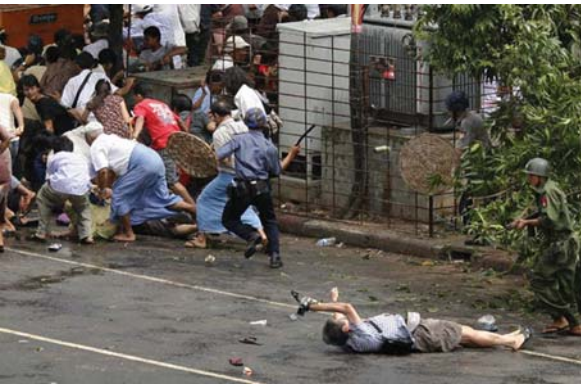
ရွှေဝါရောင်တော်လှန်ရေး၌ ဝိုင်းသန်းရွှေစစ်အုပ်စု၏ စစ်သားများ ပစ်သတ်မှုကြောင့်သေဆုံးခဲ့ရသောဂျပန်သတင်းထောက်

အရင်းရှင်၊ မြေရှင်၊ ဓနရှင်သည် အတ္တဝါဒဖြစ်ပြီး ကွန်မြူနစ်ဆို ရှယ်လစ်ဘုံစနစ်သည်ပရဝါဒဖြစ်သည်ဟု ဆရာဆရာများက သွန်သင် ညွှန်ပြခဲ့ဖူး၏။ အဖိနှိပ်ခံပြည်သူလူထုလွတ်မြောက်ရေး၊ အမျိုးသားနိုင်ငံ ရေးပြန်လည်ရင်ကြားစေရေး၊ သင့်မြတ်ပေါင်းစည်းရေး၊ တိုင်းပြည်ထူ ထောင်ရေး၊ စနစ်သစ်အစားထိုးစနစ်ဆိုးဖယ်ရှားရေး-စသည်တို့ကား ပရထွန်းကား/အတ္တအကျိုးခံစားရသည့် သမာသမတ်ဝါဒဖြစ်၏။ အချင်းချင်းအပေါ် သဘောထားကျဉ်းမြောင်းပြုမှု၊ ရန်သူနှင့်ကျတော့ စိတ်ရှည်သဘောထားကြီး၊ မဟာမိတ်အပေါ် တင်းမာခက်ထန်၊ ရန်သူ နှင့်ကျတော့ ပျော့ပြောင်းပြင်သာ၊ ဤအထာအမူအယာကျင့်ထုံးသည်