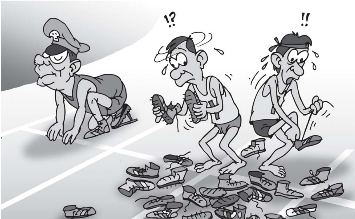
2010 ရွေးကောက်ပွဲ၊ ဒင်းတို့ပဲအသင့်ဖြစ်၊ ကလိမ်ကကျစ်နည်းနဲ့အနိုင်ယူ