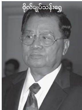
ဗိုလ်ချုပ်သန်းရွှေ

၁၉၆၂ မှ ၁၉၈၈ တပါတီအာဏာရှင် ၂၆ နှစ် အုပ်ချုပ်မှုနှင့် ၁၉၈၈ မှ ၂၀၀၈ နဝတ/ နအဖ ဖက်ဆစ်စစ်အာဏာရှင် အနှစ် ၂၀ ခါး မိုးကြီးစိုးမှု၊ နှစ်ခုပေါင်း ၄၆ နှစ် သက်တမ်းမှာ နည်းနည်းနောနော မဟုတ်။