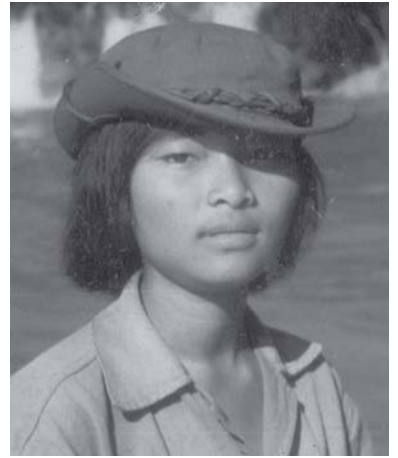
အင်းသီင်းဆွင်