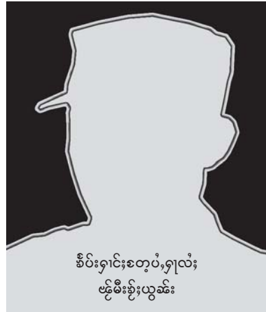
ခိပ်းရှမ်းစတုဝံးရှပ်လံး ဖွဲးမီးနွဲးယွမ်း

လှိုင်းစတု လံးလျးမိုင်း ဝီဆီတံးဆွဲ ယူ၊ ပင်လှိုင်း။ ကွဲတင်းဝီဆီ ဂူဆွဲရှေးဂျးတင်း၊ ရှမ်းသိဆွဲ။ ပေးဝါး စတု၊လံးလှိုင်းဖိုဆွဲမေး ဂေး၊ လံးစပ်းပေးသေ လှိုင်းယွမ်းပွတ်းကွက်၊မိုင်း