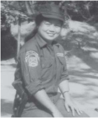
စုန်းသိုက်လှိုင် စမးမေတၢ်အိးထေး