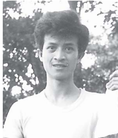
လဝ်းသိုင်သိုက်