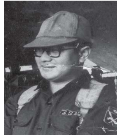
လဝ်းသိုဝ်ထီဆဲး