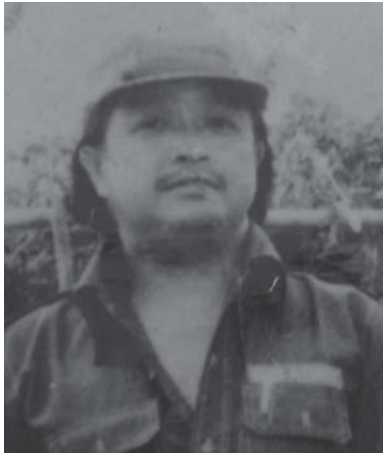
လဝ်းသိုဝ်ဆမ်၊

တီးဆဲးဆဲး လွင်းယုဂ်းယွမ်းဗူးကွခ်ဂွပ် ဂေးလိုင်ပီခ်ဗူခ်ဆဲး ကမ်၊ ပေးလီလီစခခ်။ ဂူလ်းဂျ၊ စွဲလီစခခ်၊ ကခ်ဂူဆဲးတင်းဆမ်ဂံ၊ ထတ်းသင်ဝါး-လွင်းယုဂ်းယွမ်းဗူးကွခ်ဂွပ်