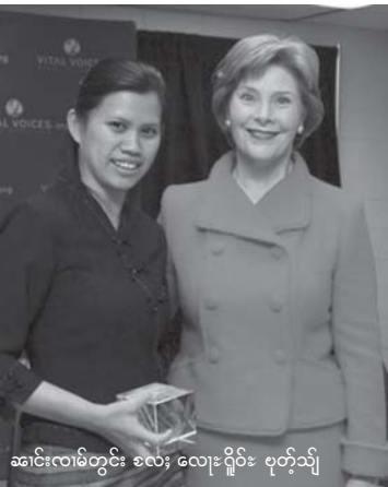
အင်းလမ်းတွင်း စလေး ဝေးဂိုင်း ဗုဂ်းသို

ဂီဝ်၊ဂပ်းပင်ယင်၊ဂင်လုကဆဲသိုဂ်းမာဆဲး လွဂ်း၊ငိုတီးဂူဆဲးမိုင်း ဂမ့ထိမ်ဆဲဆဲ မဆဲးအင်းလတ်းထိင်းဝုး - “လုမ်းဖှာ၊တဂ်းလံးတဂ်းတု သိုဂ်းမာဆဲးဂုးသမ်၊သီဆဲပိုင်လုင်ဂပ်။ ကဆဲ၊ပုးတူဝ်တီဆဲး ဂူဆဲးမိုင်း စပ်းရှုပ်းပင်ဂုမ်လုင်လုင်လတ်းသေ စိဆဲမဂ်းမဆဲးပိုင်ပိုင်းစပ်ဆဲ ဂူဆဲးဆဲး