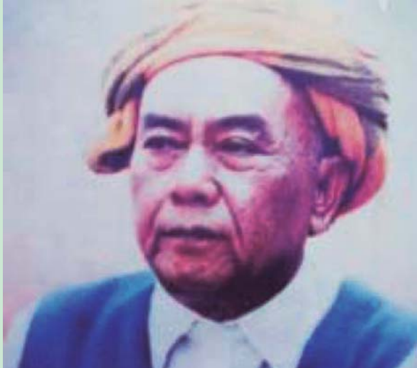
ဗိုလ်ချုပ်ကြီး ကွမ်းဖိန်း (ဝါ) မိုးဟိန်း

ဒီကနေ့ ကျနော်တို့ ပိုပြီး စုစည်းလာသလောက် ရန်သူကလဲ ကျနော်တို့ထက် ပိုအားကောင်းလာတယ်။ အာဆီယံနိုင်ငံတွေ သိပ်မကြိုက်ကြတဲ့ အိမ်နီးချင်းအိန္ဒိယနဲ့ တရုတ်တွေဟာ ကျနော်တို့နိုင်ငံပရမ်းပတာဖြစ်မှာကို သိပ်မလိုချင်တာလဲ ကျနော်တို့ သိတယ်။ ကျနော်တို့ တိုင်းရင်းသား တွေ ပြည်ထောင်စုထဲက ခွဲထွက်မှာကိုလဲ သူတို့ မလိုလားဘူး။ ၁၉၉၃ တုန်းက ခွန်ဆာသျှမ်းပြည်လွတ်လပ်ရေး ကြေငြာတာကို ကြည့်ရင် ထင်ရှားစွာ မြင်နိုင်ပါတယ်။ သူ့ရဲ့ စစ်တပ်ကို ဗမာစစ်တပ်က တရုတ်အကူအညီနဲ့ တိုက်ခိုက်ပြီး ရွေးစရာလမ်းမရှိတော့လို့ နှစ်နှစ်အကြာမှာ လက်နက်ချခဲ့ရပါတယ်။ ဒါဟာ ကျောက်တုံးကို ကျနော်တို့ ကြက်ဥနဲ့ ပစ်ပေါက်ခဲ့လို့ ဖြစ်ရတာပါဘဲ။