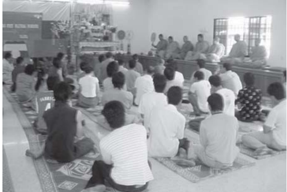
မလေးသျှား

ညနေ ၆း၃၀ နာရီ ၌စတင်သည့် ဆုတောင်းပွဲတွင် ပွဲဖြစ်မြောက်ရေးကော်မတီ နန်းချစ်တောင်းက ဆုတောင်းပွဲ ကျင်းပခြင်း ရည်ရွယ်ချက်ကို-“ ၂၀၁၀ မှာ ရွေးကောက်ပွဲကျင်းပမယ်ဆိုတဲ့ ဖေဖော်ဝါရီ ၉ ရက်က နအဖစစ်အစိုးရရဲ့ ကြေငြာချက်ဟာ ပြည်သူလူထုရဲ့ဆန္ဒအစစ်အမှန်ကို လစ်လျူရှုမယ်၊ နိုင်ငံရေးအကျဉ်းသား တွေကိုလွတ်မပေးဘူး၊ နိုင်ငံရေးပြောင်းလဲမှုမရှိစေဘူး ဆိုတဲ့ သူတို့ရဲ့ အတင်းအဓမ္မ သဘောထား -အထင်အရှား သိမြင်နေပါတယ်။ အပူချိန် -၃ ဒီဂရီ အအေးခါတ်ပြင်းထန်တဲ့ ပူတာအို အကျဉ်းထောင်က ထောင်ဒဏ် ၉၃ နှစ်ကျခံရသူ သျှမ်းတိုင်းရင်းသားများ ဒီမိုကရေစီအဖွဲ့ချုပ် ဥက္ကဋ္ဌ စစ်ခွန်ထွန်းဦးဟာ လွန်ခဲ့တဲ့ ၃ လကစပြီး ရှိရင်းစွဲရောဂါအပြင် ဆီးရောဂါ အသည်းအသန် ခံစားနေရပါတယ်။ စိတ်ရောဂါခံစားနေရတဲ့သူအပြင် အခြားခေါင်းဆောင်တွေ ကျန်းမာရေးအခြေအနေ အတော်ဆိုးရွားနေတာတောင်မှ ရောဂါအထူးခွဲစိတ်ကုသခွင့် မရခဲ့ပါဘူး။ ဒါကြောင့် စစ်အစိုးရ ပိတ်ပင်ဟန့်တားမှုကြားက ရောဂါဝေဒနာအမြန်ဆုံး ပျောက်ကင်းစေဖို့ အကျဉ်းသားဘဝမှ အမြန်ဆုံးလွတ်မြောက်ပြီး စစ်မှန်သော