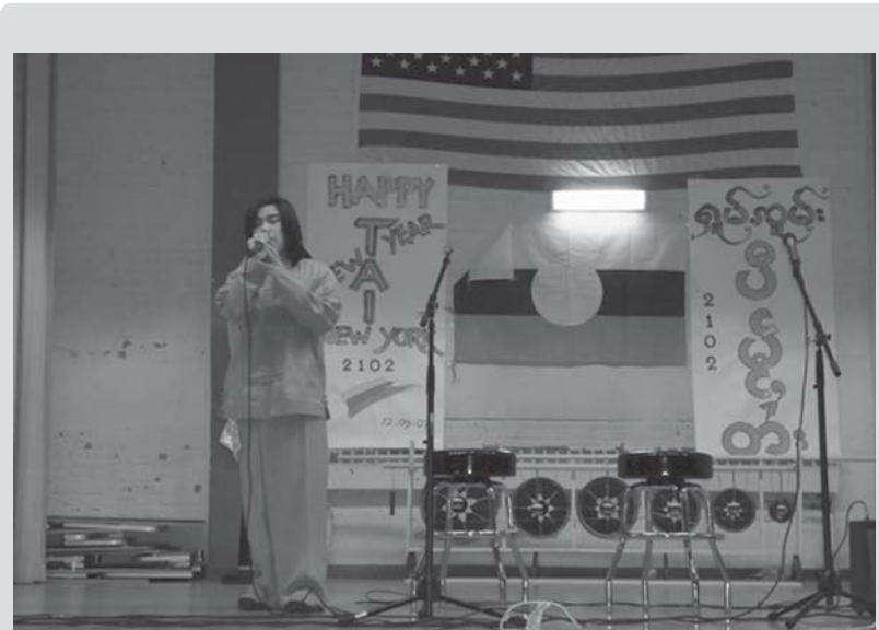
ပီဆွင်တံးလှိုင်းယူ, ဆွမ်းမိုင်း ကွမ်ဂမ်စပ်းရှိုတ်းပွဲးဝမ်းပီမ့်, တံး တံးဝီင်ဆိင်ယွက်, လိုင်းတုမ်ဂိမ်, ကမေးဂိုဝ်း (USA)

ဗွဲးကတ်းပါင်ပွဲးပီမ့်, တံးဝီင်လမ်း တမ်းဂေ့, ဆိုင်းလတ်းဝါး- “ဝမ်းထီ 8 ရှမ်းစပ်းရှမ်းမီးမုး 200 ပံး ဝမ်းထီ 9 စတု တံးရှမ်းဂေ့လိက် ပေးကမ်းမီးတီးဆင်, တင်း မုးတံးမုး 500 ပံး။ ပီဆွင်မုဆိုး တင်းတင်, လတ်းစိုဝ်းဂေ့လိက်ရှိုတ်း, လှုပ်ဆဲး ပီဆွင်ထံး