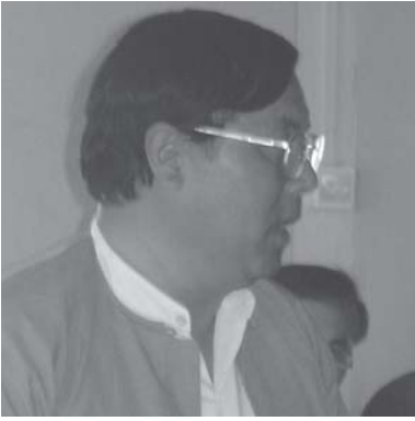
လင်းစုအဖွဲ့အစည်း

လင်းစုအဖွဲ့အစည်းတိုးတက်မှုများအားလုံးကို ပီအမ်အိုင်