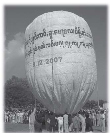
ပွဲးပီမို,တီးတီးဝါးဝါးဝိုင်းလူင် တူင်,ဝိုင်းရှိုင် လေးတွမ်းရှံးပွဲး, (လိုင်းထံး)

ဂျးစပ်းရှမ်း၊ ဂွမ်းစွမ်းဂိုဆိမ်းဆပ်ပူဝ်ရှိုင်။ ပွဲးပီမို,တီး တီးသိုင်းဂပူဝ်းကျေး မွှ်, လံးသိုင်လွမ်ဖျာ တင်း ပူဝ်,အိပ်, (တံး-ထဆူ မေ့ရွင့်ဂွမ်းမာဆိမ်း) ဂျးစပ်းရှမ်းရှပ်တွမ်းပီမို, တီး။ တီးမလေးသိုဝ်းကျေး မီးပင်စပ်းရှံး ပွဲးပီမို,တီးသေ မီးပင်ဂျးဝိမ်ဖိုင်းစး၊ ကိတ်, ပင်မူဆိမ်းသိုဝ်းပာဆိမ်း။