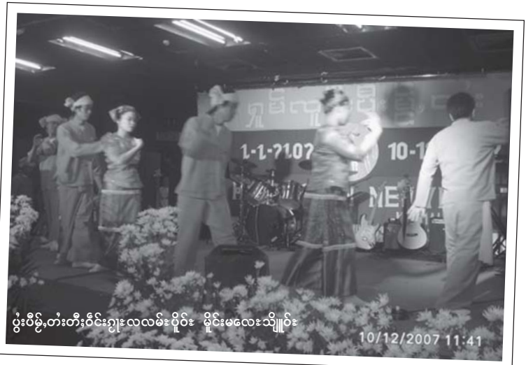
ပွဲးပီမို,တီးတီးဝိုင်းဂျးလလမ်းပိုဝ်း မိုင်းမလေးသိုဝ်း

ဂျးစပ်းရှမ်း၊ ဂွမ်းစွမ်းဂိုဆိမ်းဆပ်ပူဝ်ရှိုင်။ ပွဲးပီမို,တီး တီးသိုင်းဂပူဝ်းကျေး မွှ်, လံးသိုင်လွမ်ဖျာ တင်း ပူဝ်,အိပ်, (တံး-ထဆူ မေ့ရွင့်ဂွမ်းမာဆိမ်း) ဂျးစပ်းရှမ်းရှပ်တွမ်းပီမို, တီး။ တီးမလေးသိုဝ်းကျေး မီးပင်စပ်းရှံး ပွဲးပီမို,တီးသေ မီးပင်ဂျးဝိမ်ဖိုင်းစး၊ ကိတ်, ပင်မူဆိမ်းသိုဝ်းပာဆိမ်း။