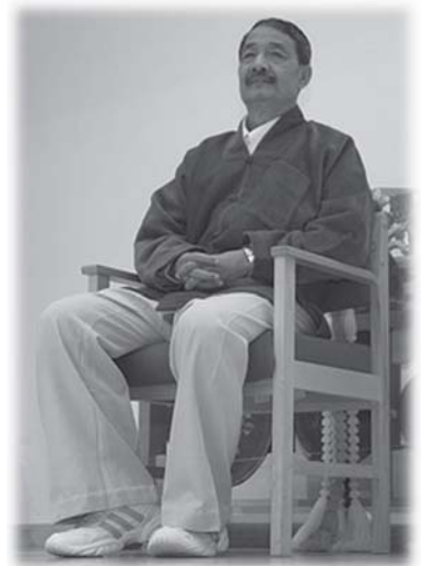
မုးတံးမုးရှမ်းလူင် တွက်, တိုဝ်း လံးစမ်းလီဂ်း ဆွံးဝမ်းပီမ့်, တံးလံးလမ်းတမ်း

လို့ဆင်, ရှမ်းဂမ်လတ်းရှိုတ်း ပါင်ပွဲး ရှပ်းလီင်၊ ဂိမ်လီင်၊ ပံးလီင်၊ လီဆံးလီင် လွမ်း ဆင်, ငဝ်းလံးဗွဲမဆဲးပွင်ပီဆဲးလံး။ တီးသီမိး ပိုဝ်း ဝမ်းထီ 8-9 ဂေ့လိက်လံး ခလး ဗွဲင်စး ဆမ်းဆး၊ ဝီင်လူင် လမ်းတမ်း မိုင်းကိတ်ဂလီတ်ဂေ့လိက်ရှိုတ်း၊ ဂင်ဝမ်းမီး ပါင်ကုပ်, ကုပ်ဂိပ်, ဂပ်ပိုဆဲးဗွဲင်ရှိုတ်းရှိုတ်း၊ ဂင်စမ်းမီးပါင်လုပ်, မုဆိုးတူဆဲးလုံ။ မုးတံးမုးရှမ်း လူင် တွက်, တိုဝ်း လံးစမ်းလီဂ်း၊ မေ့ရှင်ရှမ်း လံးထီးသီင်၊ မုးလူင်လီဆဲးပိုဆဲးတံး တွက်, တိုဝ်း လံးသင်, ကံး၊ ဗွဲဆမ်းဂေ့လိက်ရှိုတ်းရှိုတ်း လပ်ပိုဆဲးစမ်း (လပ်မေ့, မုဆိုး မိုင်းလေး) စပ် စပ်းရှမ်း။