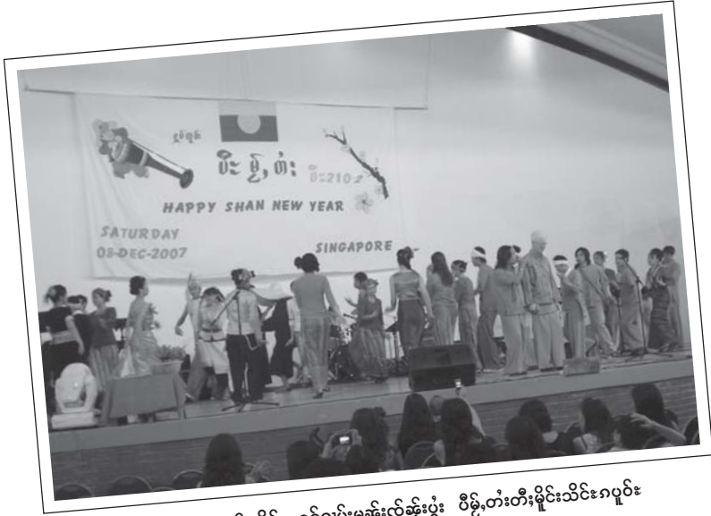
လံးသိုင်လွမ်ဖျာ ဧလး ပူဝ်,အိပ်, ရွင့်ဂွမ်းမူဆိမ်းလှဲဆွဲးပွဲး ပီမို,တီးမိုင်းသိုင်းဂပူဝ်း