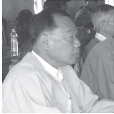
လင်းစုအဖွဲ့အစည်း