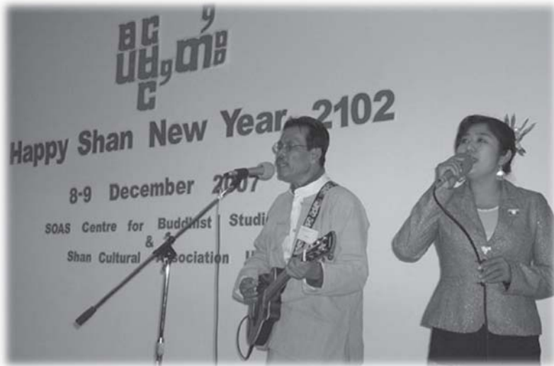
လံးထီးသီင် ခလး ဆင်းစမ်းဆွံ့လီဂ်း ရွှေဇိင်မုဆိုးလုံပဆဲးမုးစပ်းရှမ်းပွဲး ဆွံးဝမ်းပီမ့်, တံးလံးလမ်းတမ်း (London, UK)