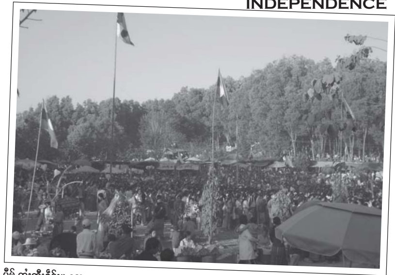
ပီမို,တီးတီးဝိုင်းမူ,လေး

ပွဲးပီမို,တီး တီးဝိုင်းမူ,လေး တိမ်လွဲ တိုင်စမ်း ဂွမ်းစပ်းရှမ်းစွမ်းဂိုဆိမ်း တေး, ပေးထိုင်ဆိုင်လွဲတိုင်စမ်း။ ကတီးရှံးတီးသမ် ဝမ်းသမ်ခိုဆိမ်း။ ဝိုင်းလူင် တူဆဲးတီးကျေး ကတီးရှံးတီးပျားပွဲးပူသင်,ကဆိမ်းဂိုရှံးပွဲးပီမို,- ကျေလိက်းဖိုင်းတီးဆွင်ရှံးယျး၊ ရှမ်းပူဝ်း၊ ရှပ်ပူဝ်း၊ ဆမ်စုဂ်၊ သံးစလး၊ ဆွင်ဂျ၊ ဆွင်မွမ်း ကွမ်းကဆိမ်း