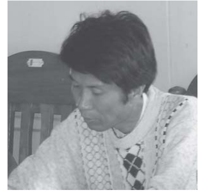
လင်းစုအဖွဲ့အစည်း