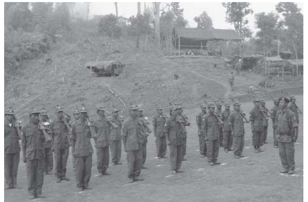
ကန္တာရဝတီတိုင်းမိ အောက်တိုဘာ ၁၈ ရက်