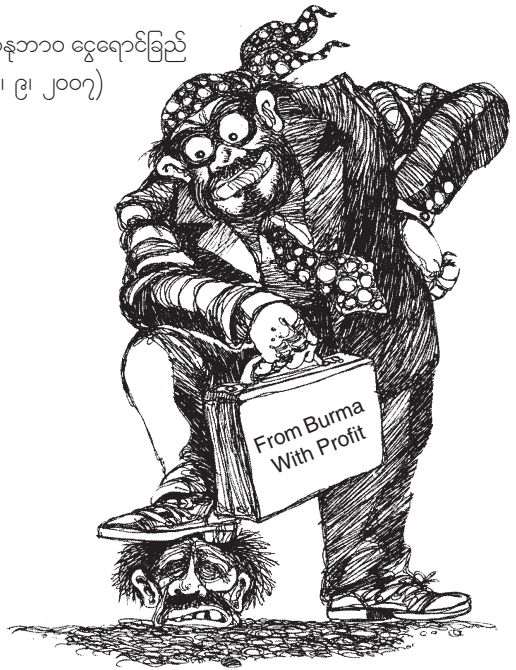
အာနုဘာဝ ငွေရောင်ခြည် (၃၀၊ ၉၊ ၂၀၀၇)

စစ်အာဏာရှင် အစိုးရရဲ့ ကံကြမ္မာကလဲ ကံသေကံမ၊ မရေရာ လှတော့ဘူး။ ပြည်သူပိုင် သဘာဝသယံဇာတနဲ့ အပေးအယူလုပ် ဈေးဆစ်ပြီး မိမိသက်ဆုံးရှည်အောင် ရေနံနဲ့ဓါတ်ငွေ့ကို ကတုတ်ကျင်း အဖြစ် အသုံးချနေလို့ပါ။