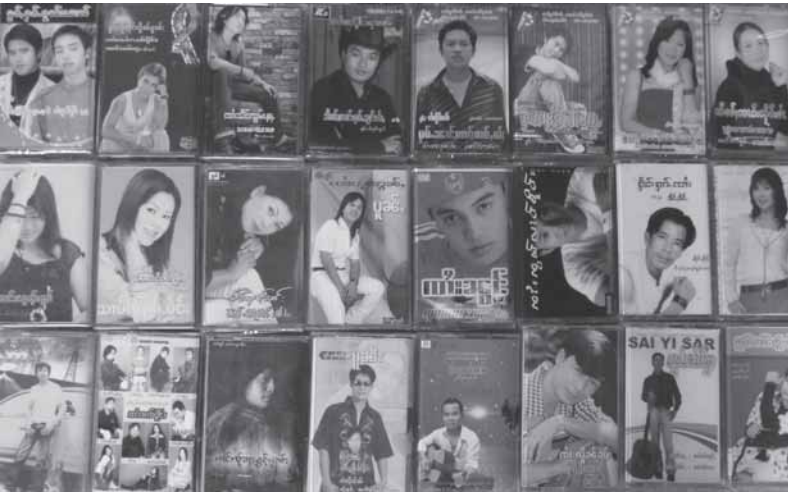
ခိမ်းထိုက်ခံးလိသိုက်၊ မေး-ရှုလှိုင်လံး

အင်းမာဆဲ၊ ဆဲးတုးရှပ်း၊ သမိုင်းလား၊အိမ်း ရိုက်ပေး-သွင်ပံးခံး၊ဂါဆဲဂမ်းဆဲ-ရှမ်း တွံးတိုင်၊ (ဆဲးတုးဆဲးထြီး musician) ယင်း ယု၊တုးရှပ်းဂေးဆိုင်၊လားတုးခဆဲ။ ဝိဆဲရှပ်းဂေးလိ အင်းရှမ်းတံးပာဇ်ဖြူ- လှိုင်းကွက်၊မိုင်းဆဲးဝီ 2007 ဆဲပိုဝါသိုင်းသိုင်း ခံးဆဲဆဲ ပေးမုးလိခင်းရှိုင်းတုးလှိုင်းခံးထိုက် (tape) တင်းအိဆဲ၊ CD (Karaoke လှိုင် music video လှိုင်) ကဆဲလံးခံးလိ ပွတ်းလိဆဲလိဆဲ ခမးသံ၊ တုးစီးလိခင်း သိုင်းသားလှိုင် ဆဲး 2-3 လှိုင်းပူဆဲမုးဝိဆဲလှိုင်းဆဲဂမ်းဆဲ-ရှမ်းဆဲမိ၊ ကာယု 17 ပိုင်းရှမ်းသိုင်းရှင်တံးခမးသံ၊ လား၊ ခဆဲဆင်၊ဆဲ။