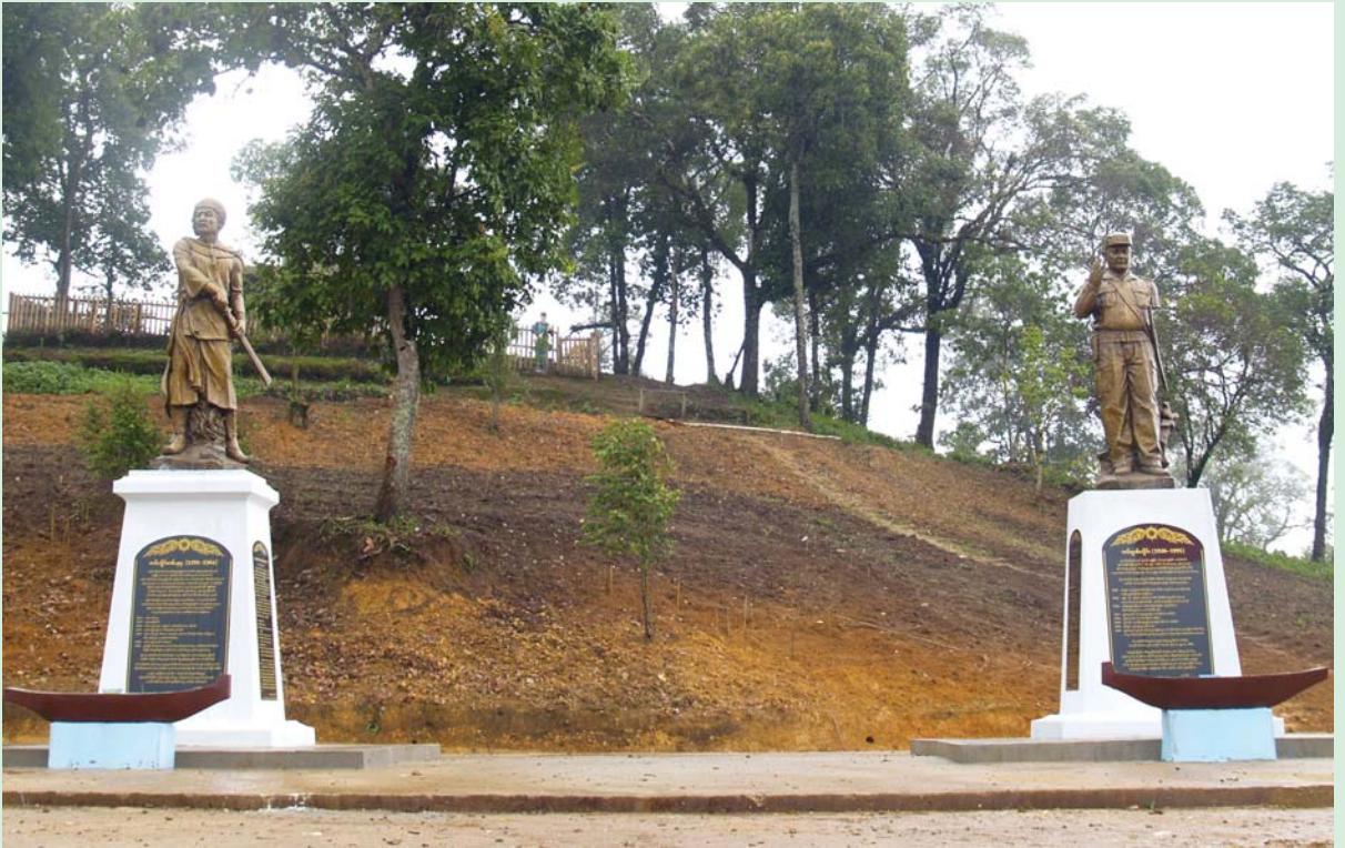
ရှုမ်းရှင်းပန်း၊ လင်းသိုဝ်းခမ်း၊ ဖျာ၊ ခလေး၊ လင်းခွမ်းလှိုင်း၊ တေးဆေးခွင်းရှေးလင်းမိုင်း၊ တီးငင်းငုန်းလွဲတံးလင်း (ကမ်းယို၊ ပိုင်းတူဝ်ဂုမ်းခတု)