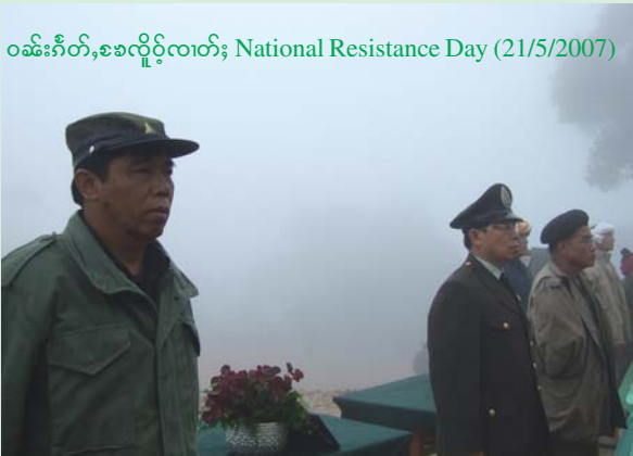
ဝမ်းဂိုတ်၊ ခခလိုဝ်းလတ်၊ National Resistance Day (21/5/2007)