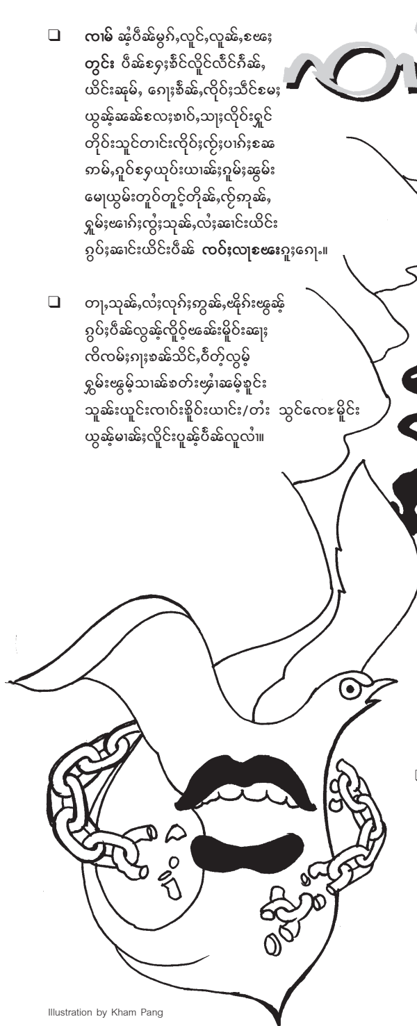
Illustration by Kham Pang