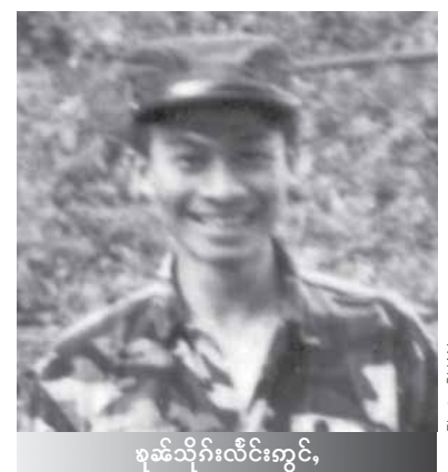
စုဆံသိုင်းလိင်ကွင်

ဝံးပင်တိုင်းဆန်ယဝ် လင်းမိုင်းလိုမ်း ဂေ့၊ လိမ်းလှ်း သိုင်းမာမ်းဂေ့၊ ယျာရှပ်းသေလှ်း စလး မမ်းလင်းယင်းကပ် ခွင်ပွတ်းပမ်းမာမ်း 1 လမ်း ဝါးပီဆံကန်ထိုင်းလံး တီးတူင်တံာ် စုဆံသိုင်းလိင်ကွင်။