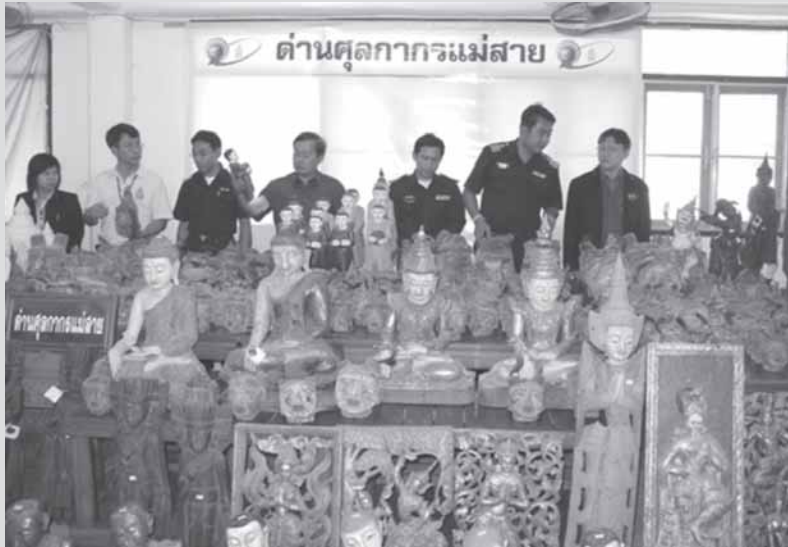
ခွင်ခွင်ဂပ်၊မွမ်၊တင်းသိင် ကမ်လင်းဆုးတီးထံးရှပ်းယိုက်းလံး

ခွင်ခွင်လိုင်ကမ်ယိုက်းလံးမားလိုင်ဆဆွဲ တင်းသိင် ဂုးစဆိတေမီးမွတ်း 3 လားဆွဲဝတ်၊ ဆံယဝ်။