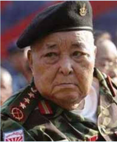
လွင်သိုက်လိုင် သေးပိုင်၊မျိုး ဂေါ့လမ်းဆွမ်းလိုင်းဂျ၊