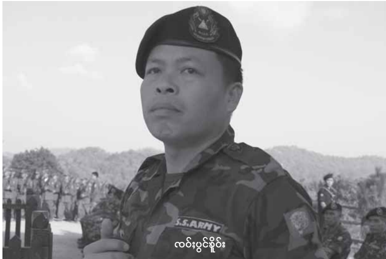
လင်းပွင်စိုင်း

ကိုင်ဆိုင်လိင်၊ ခက်၊ ပွတ်းလမ်း ပွင်၊ များ သေ မီးပျားဆွဲ ခွမ်းစေ့မံ 229 (January 2007) ရှင်စေးဝါး သိုင်းမာမ်းတင်း လုမ်း မိုင်းလိုမ်း၊ ဝီတိုလွမ်ယိုင်း သိုင်းတံးပွတ်းမိုင်းဂိုင်း။ သိုင်းတံးတူဂ်းသုမ်း 6 ဂေ့၊ သိုင်းမာမ်းတံာ် 1 ဂေ့၊ မာတ်၊ 7 ဂေ့၊ ရှပ်းယိုင်းလံးဂွင်းဂင်၊ တင်းဆမ်ဆန် ပိုဆ်းစေးယဝ်ဂေ့၊ ခက်းတင်း 2 လိုမ်းပုဆွဲမားဆွဲ တူင်၊ ပွင်းတံးဆွတ်းမိုင်း လိုင်း သုမ်းလှ်းထွမ်၊ ကုပ်၊ တေ့၊ တံ၊ သိုင်း၊ စံးသွပ်သိုင်း ဂမ်ဝါး ကန်တူဂ်းသုမ်း ဆွဲပင်တိုင်းဆန် ပျား တင်းတူင်ဗုဒ္ဓဂွမ်းသံးသိုင်း SSA-S လင်းသိုင်း ပွင်စိုင်း (ကန် ကွမ်ရှင်သိုင်းတူင်ဆိုင်ယူ၊ ပွတ်းဂင် ဆွဲဆေးလိမ်ဂင်၊ လုမ်းမိုင်းလိုမ်း) လူးခွမ်း၊ ဝါးဆံ။