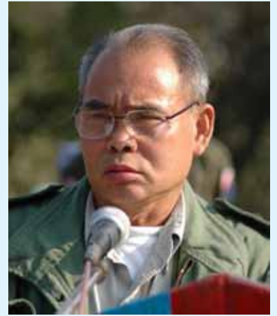
ဖုန်းဆမ်းဆွဲ၊ KNU ဝတုင်မာဆဲးသျှ၊