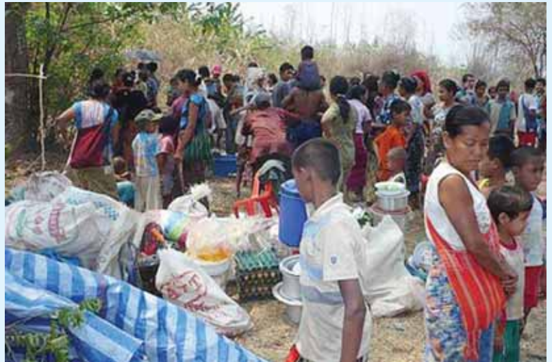
ဂူဆဲးယာင်းပံးဖေးသိုက်မားလီဆဲလီဆဲထံး (ဂမ်းဖွင်ဂေးပီဆဲစတားဆေး စဂးဂျီးတေးဂဆဲ)

“ ကမ်၊ဂွမ်ဂျးမာဆဲးစလးတံး၊ မာဆဲးစလးယာင်းဂူလုး။ ပေးတူလုးလုမ်းမာဆဲးစလး လုမ်းလောင်းခိုင်း 7 လေးမိုင်း လိုင်းကမ်၊လုးမာဆဲးဆွဲ ဖွဲခီဆဲ၊ဖွဲခုလုး၊ ဖွဲဂီဆဲ၊ဖွဲဖုလုး၊ ဖွဲလုလုးဖွဲလုမံ၊ ဖွဲကူမံဂီဆဲ၊ ဖွဲထူမံလီဆဲ၊ လီစတံးခီဆဲထတံးသီဆဲလီပံးဂီဆဲးယူ။ မာဆဲးခီဆဲ၊စလးရှင်းခုလုး၊ မာဆဲးဂီဆဲ၊စလးရှင်းဖုလုး၊ရှင်းခုလုးစလးမာဆဲးခီဆဲ၊ ရှင်းဖုလုးစလးမာဆဲးဂီဆဲ။ ဖွဲခီဆဲ၊ဖွဲခုလုးလှိုဝ်ဖွဲ၊ ဖွဲဂီဆဲ၊ဖွဲဖုလုးလှိုဝ်ဖွဲ၊ ရှာဆဲလံးယူ၊သင်းသင်း၊ လံးထုဂ်၊မာဆဲးလင်းစဖေးလီဂီ၊ ခိုဆဲးထီဂ်၊ထိုဝ်ဂဆဲ၊ ဂပ်လဆဲမံးရှုဂ်၊ ဂပ်လုဂ်မံးလုမံ၊ ဂပ်လုမံးမံးခီ၊ ဂပ်လီမံးလု၊ နီင်၊တု၊တိုဂ်းတေးဂဆဲ၊ မာဆဲးလဆဲယွဲးယွဲးမုဆဲး၊ သူဆဲးဖွဲ၊ ပီဆဲတီးလုမံးတံးယဝ် သိုဝ်၊ပီဆဲတီး လုမံးယာင်း။ လံးတောင်းတီဂ်၊ယံးလုလီဝ်ငီဝ်မွင်၊ ဖေတ်၊စဖေဝီဆဲဂျ၊သွင်သမ်လုမံး၊ ဖေတ်းမေးကုမံးရှုဂ်ခုဂီဆဲ။ ”