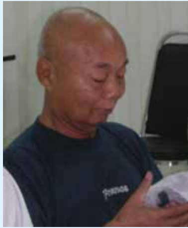
ဖုန်းပွင်ဂါဆဲသိုက်၊ လွင်သိုက်၊ မူ၊တူး သေးဖုန်း