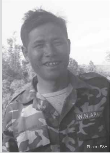
လင်းသိုက်လူင် တိုက်မိုင်း

လင်းသိုက်လူင်တိုက်မိုင်း ဖွင်းဂွမ်းသိုက် WNA လတ်းဝုး “ဝမ်းထိ 25/03/07 ပုဆိ မုး တပ်သိုက်လိုင်းလတ်းဝုး (WNA) တိုင်း တပ်သိုက်လိုင်းတီးပွတ်းလမ်း (SSA-S) ရှိုင်း ဂါမ်ကပ်ရှိုင်း 38 ဂေ၊ ကွက်၊ တိုင်းဂူ၊ တူင်ဆိုင် တိုင်းရှိုင်းလွမ်းဂါမ်စလးလုံးထုက်၊ သိုက်မာမ်း၊ စမယ 514 တိုင်း ပီ၊ တုလိတုရှိုင်းမိုင်း ရှိုင်း သိုက်မုတ်းပွဲ၊ ယိုင်း ဖွင်းရှိုင်းရှိုင်းမိုင်းမုက် 7 ရီး လူင်။ ယိုင်းဂါမ်ရှိုင်း 10 မိဆဲတုယိုက် သိုက်ဝုး တူက်းသုမ်း 1 ဂေ၊ သိုက်တီးတူက်းသုမ်း 1