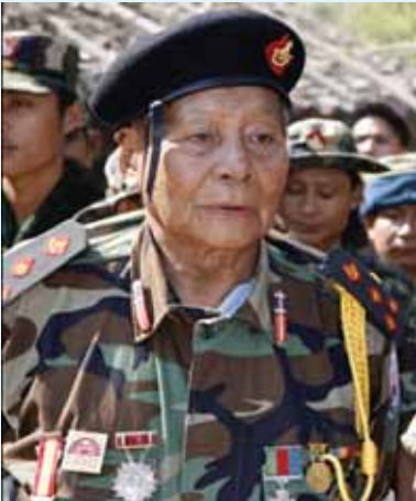
လွင်ရှာဆဲထီင်၊မွင်၊ (ဖုန်းဂွင်လင်ဖေတ်၊ဖုင်)