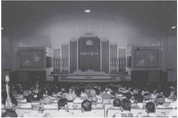
စာမှက်နာ 33 သို့

စစ်ဗိုလ်တစ်မတ်သား ပါလီမန်၊ ကာကွယ်ရေးဦးစီးချုပ်သည် ဒု-သမ္မတ၊ တပ်မတော်သည်နိုင်ငံတော်အာဏာကိုအချိန်မရွေးသိမ်းယူ နိုင်ခွင့်စတဲ့-စတဲ့ ပြဋ္ဌာန်းချက်တွေဟာ အနှစ် ၄၀ ကြာစစ်အစိုးရမှ အနှစ် ၄၀၀ ကြာ စစ်အစိုးရဆီ ဦးတည်နေတယ်မဟုတ်လား။ တစ်ပါတီ စစ်အာဏာရှင်ကိုတိုက်ဖျက်ခဲ့တဲ့အစ်ကိုတို့ဟာ အခုအချိန်မှာ မဟာ