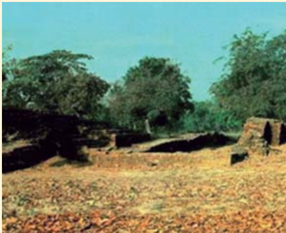
ဂဝိလဝတ်-ဝိင်းလင်းလုံး သိတ်တတ်ထ