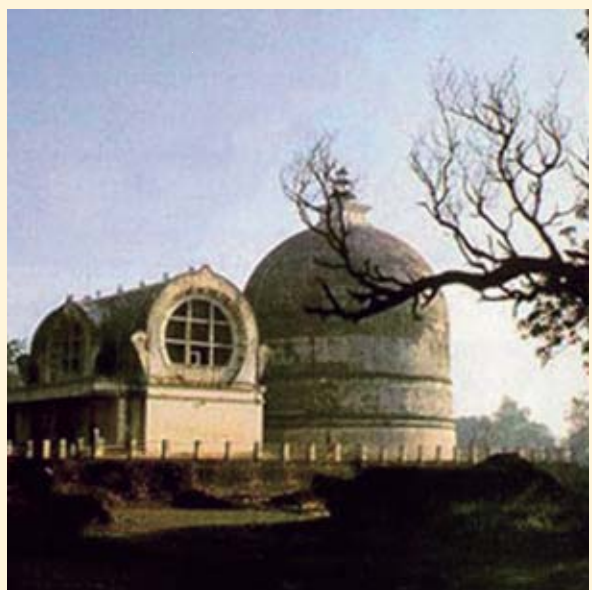
ဂုသီဆု,ရု,-တီးလင်းကပ်ဆိပ်ပမ်,