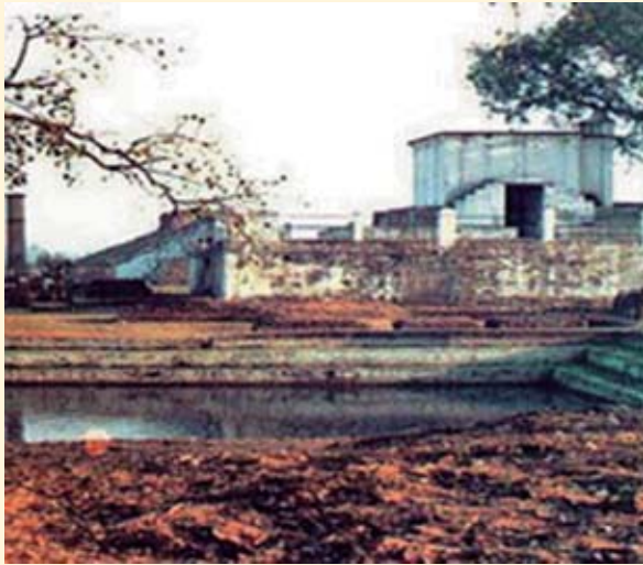
လှမ်းမီဆီး-တီးဂိုတ်,လင်းလုံး သိတ်တတ်ထ