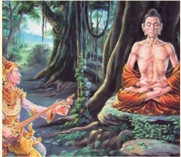
မိုင်းဖွင်းတိုဉ်တိုင်းဂမ်ရှုတြး