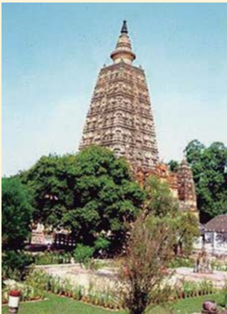
ပုတ်ထဂု,ယု,-တီးလင်းလုံး,ရှုဆဲထမ်း