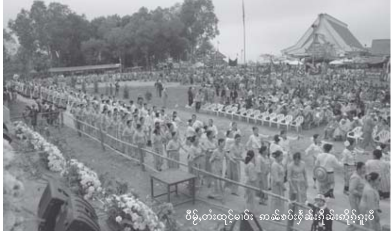
ပိမ်,တီးထုင်မာ် ကမ်စပ်ရှိုင်းရှိုင်းကိုက်ဂူမ်းပိ

ပျူး။ ပွဲပိမ်,ထုင်မာ်လုပ်လိုမ်း ကမ်ရှိုင်း, တီးမး. မေးတွင်း. ဆွဲကုမ်းပမ်,ပုတ်ဂမ်ရှိုက် ဆွဲပိမ်ဆွဲတီးဆွဲ ပိမ်ဝါမ်းမေးတွင်းရှိုက် တီးဂင်ပင်,သုမ်းရှိုင်းရှိုင်းဝတ်ပွက်ဂါတ်. ဆွဲဂေး ဂင်ခိုမ်းမီးပွဲ,တိုင်းရှိုင်းရှိုင်းစွမ်းပွဲစလး ပလိက်မာ်,လွပ်,စာပ်, (SB) စံး,လိမ်းကူး။ ဂူင်,ဆံး,(တပွဲလွပ်,စာပ်, MAS ထာ်) လုမ်းစမး ဖွဲ. လုမ်းဂျှုဆွဲ ဖုတ် လူင်လိမ်းတင်းဂူမ်း KDA (ဆွဲရှိုက်သိုက်စပ်ပွဲ) စပ် 3-4 လုမ်း ရှိုက်ဂမ်သိုက်စာတ်မပ်တီးကပ်ပွဲ ကွင်း ပုလူတ်ရှိုင်းဂါမ်ပိုမ်း။ ဂေးပွင်ပိမ်ပွဲမာ်မမ်းပွဲ ရှိုက်ပွဲဂေးပုလူတ်ရှိုင်းဆွဲလမ်း 300 ပျူးဂေး လုမ်းစာတ်မပ်ဆွဲပွဲဆွဲလမ်း 500 ပျူး။ လိုင်းသေဆွဲ လုမ်းစံး,လိမ်းကူး/ ရှိုက်, ဆံး,စပ် 7-8 ဂေး. ဂျှု,လိုက်ဂါမ်ဂံ,လပ်စပ် ဆွဲ လွင်တင်းစံးစပ် 2 ခိုမ်းတူက်မိမ်း 4 မိုမ်း,ပံးဆွဲဂေး တိုက်ရှိုက်လွင်ပွဲစေ,ပမ်ဂွမ်း, ဆံယဝ်။ ပွဲပိမ်,တီးလုပ်လိုမ်း တီးမေးတွင်းဆွဲ ဂူမ်းစပ်ပွဲတေးမီးမာ် 15,000 ။ ဂမ်းဆမ်ဝါး ဂိုမ်းလိုင်းသေပိမ်,တီးပိင်းပင်,သံးစလး လေး လာမ်း။ ယူ,တီးဂေးလိက်လံးဖွဲစမး ကိုင်း, ဆွဲကုမ်း/မေးတွင်းတင်းကမ်ပိမ် ဂေးဖွဲ တူင်,ပိင်းမူ,လေး စပ်ဂူမ်းဂမ်လတ်ရှိုင်း- ဆံယဝ်။ □