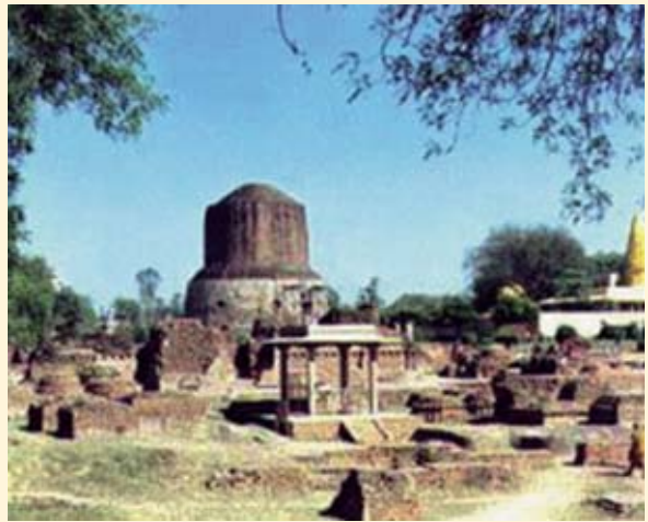
သုရဆတ်-တီးစတ,သွဆဲထမ်း ဂိုမ်းပုရုဆသီ