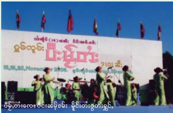
ဝိဉ်းတံးလေးဝင်းဆဲးခမ်း မိုင်းတံးပွဲးတံးရှင်,