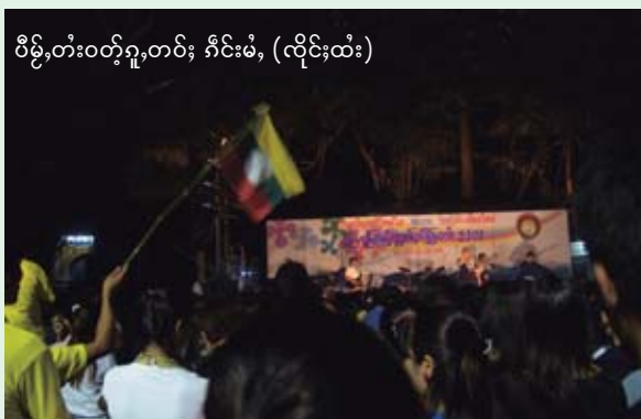
ဝိဉ်းတံးဝဲတံးတပ်း, ကိုင်းမံ, (လိုင်ထံး)