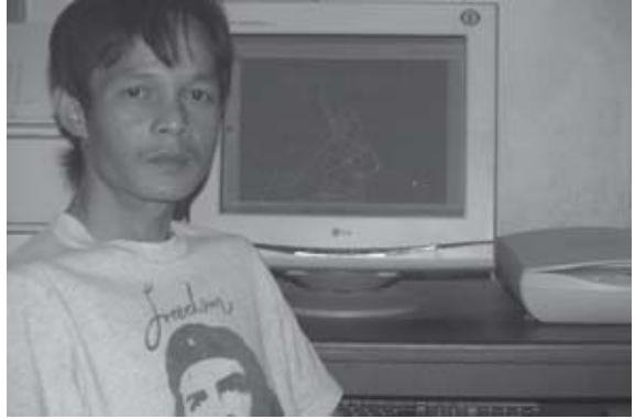
လံးစမ်းပာင်,