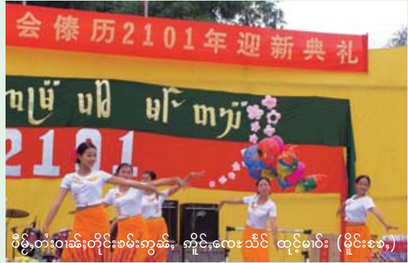
ဝိဉ်းတံးဝါဆဲးတိုင်းခမ်းကွမ်း, ကိုင်းလေးသီင် ထိုင်မား (မိုင်းခစး)