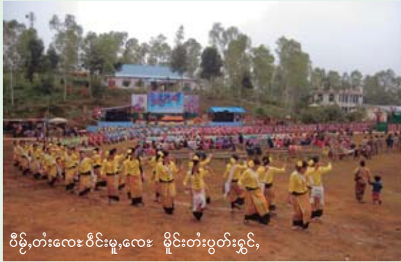
ဝိဉ်းတံးလေးဝင်းမူးလေး မိုင်းတံးပွဲးတံးရှင်,

ဆွဲးလူင်းဝမ်းထီ 15-25/11/2006 ပူဆွဲးမားဆွဲး မိဆဲးဖွင်းစားသုင်,သင်,ဝိဂပ်, ငှပ်တွမ်းဝိဉ်းတံး ပီးဆွဲးတံး လိမ်ဆွဲးမိုင်းဆွဲးမိုင်း ကွမ်းဂမ်တံးပွဲးဂိုဆဲးခိုဂ်ယွဲ, ငလး; ဖုးတံး,ဝွဲးလံးစိမ်းရှင်းမားဖှာဂ်,။