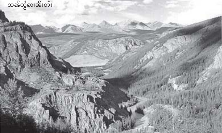
သမ်လုံကမ်တံး

မိုင်းလံပီပူဆ်.မား မီးလံးဂမ် (Program) ပိုဆ်ပွံ,ကွဂ်,ထီးဝီးခွင်. 9 မိုင်းထံး လိုဝ်းဝုး ခုဆ်ထံး (ဂူဆ်တီး) ကမ်ခပ်ဂျာ,ထံး, ထီးဝီးတီးမိုင်းမင်းဂွင်လျိုင်း(Mongolia) ဂ်ဝ်,လုလုးပံးရှေ့ဆ်, ကမ်ဝုးဂူဆ်းခိုဝ်းတီးဆ်. ကမ်,လုဂ်.တီးမိုင်းဆမ်.မား၊ လွံကမ်တီး (Altai) ဂေးကမ်,ပွင်,ဝုးပီဆ်တီးယု,တံး။ မဆ်း ပီဆ်ခေးဂွမ်းဆ်းတုင်,တင်, ခွင်လပ်းခိုဝ်း လှိုဝ်းကမ်,လှိုးတီးဆမ်.ဂုလုး၊ ပိုင်ဆိုင်ပေး လုဂ်.မိုင်းမင်းဂွင်လျိုင်း ခံ.လုင်းမားတင်း လါဆ်းလိုင် တေလံးလတ်းခမ်းဝုး ပု,သံး ဂွင်ပီ(Gobi desert) ယင်းဆပ်.ရှိုင်းဂီလုင်း