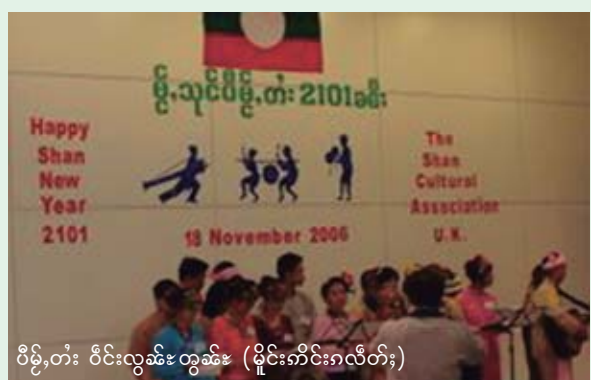
ဝိဉ်းတံး ဝင်းလွမ်းတွမ်း (မိုင်းကိမ်းဂလိတ်း)