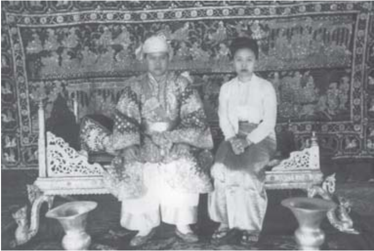
လင်းယင်းတိုင်းမှိုင်း တင်း ဂျေ.ပီ.ဆီလင်းကား လင်းသိုဝ်ဂွမ်၊ ဗွင်းပွဲးလမ်းဂွမ် (ဂမ်၊တေး) တီးရှေ့သီဆီဝီ (ကွမ်တင်းပီ 1959 မိုင်းလင်းဖျာ.ဝင်းကျ၊ဆျာ.ဝမ်လွင်ပွင်လိုင်းတီး)။