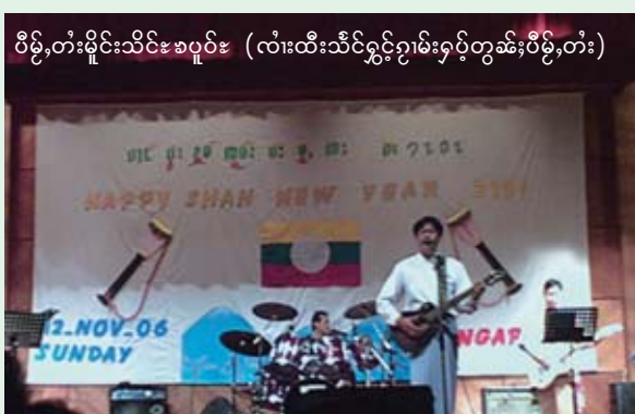
ဝိဉ်းတံးမိုင်းသိင်ခပူပဲး (လံးထီးသိင်ခပူပဲးရှပ်းတံး)