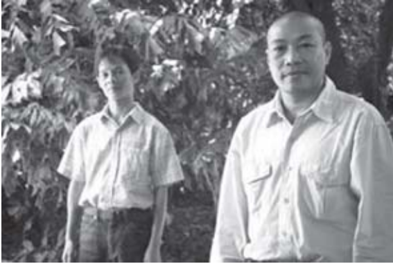
လံးစမ်းပာင်, စလး လံးရှာမ်လိတ်း