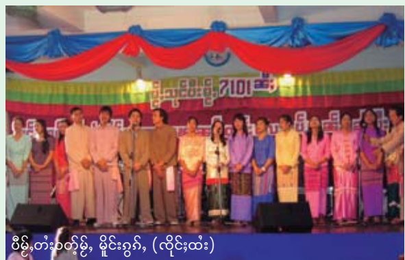
ဝိဉ်းတံးဝဲတံး, မိုင်းခွဲး, (လိုင်ထံး)