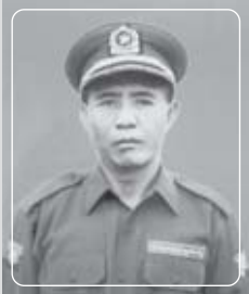
ပူဝ်,မုမ်း

လံးဂိုက်သိုက်စလး ပံးဂျးဆွဲးဆးတီးလုမ်းစာဝ် ဂိုက်သိုက် KDA (Kachin Democratic Army) ယိုင်းဂုမ်း ပွတ်းဂွင်းစာ ခွဲးလေးဝိင် ဂူတုစံး-လံးစာဝ်,ဆင်,ဆံ။ □