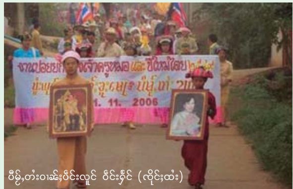
ဝိဉ်းတံးဝါဆဲးဝင်းလူင် ဝင်းခိုင် (လိုင်ထံး)