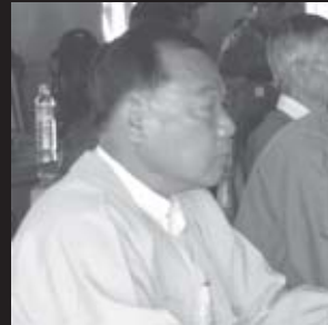
စိုင်းလှအောင်