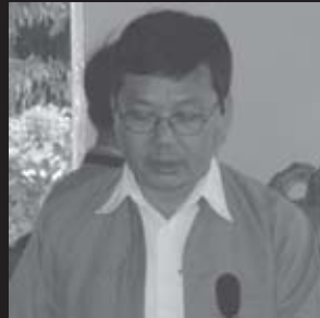
စိုင်းညွန့်လွင်