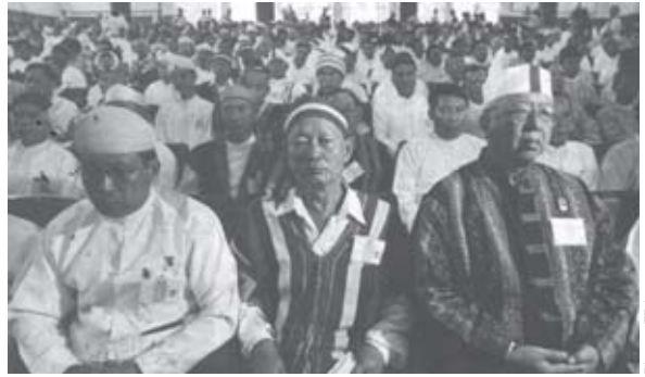
ညီလာခံသို့ တက်ရောက်ကြသည့် ကိုယ်စားလှယ်တော်များ

“အင်မတန်မှအရေးကြီးတဲ့အချက်ဖြစ်ပါတယ်။ ဒီမိုကရေစီနိုင်ငံတွေမှာ တပ်မတော်နဲ့ အခြားလက်နက်ကိုင်အဖွဲ့အစည်းတွေကို ခွဲထားရပါ