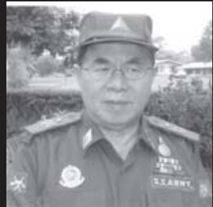
ဗိုလ်ချုပ်ဆေထင်

သို့သော်အခမ်းအနားမကျင်းပမီနှစ်ရက်အလို ၅၊ ၂၊ ၂၀၀၅ ရက်နေ့တွင် တိုင်းမှူး ဗိုလ်ချုပ်ခင်မောင်မြင့်သည် ပင်လုံတပ်နယ်မှ တပ်သားများအုပ်စုဖွဲ့တော့ခိုကြခြင်းကို သွားရောက်စစ်ဆေးနေ၍ အခမ်းအနားဖွဲ့ပွဲမတက်နိုင်ပဲပျက်ကွက်ခဲ့ရသည်။ ၎င်းအနေဖြင့်မတက်ရောက်နိုင်ကြောင်း ဖုန်းဆက်၍တောင်းပန်ခဲ့သေးကြောင်းသိရသည်။ ထို့ကြောင့် ၇၊ ၂၊ ၂၀၀၅ အခမ်းအနားတွင် သဘာပတိအဖြစ် သျှမ်းပြည်တပ်မတော်မြောက်ပိုင်း SSPC ဥက္ကဋ္ဌ ဗိုလ်ချုပ်ဆေထင်က သဘောတူလက်ခံခဲ့ပါသည်။ ပွဲကိုအဓိကစီစဉ်ကျင်းပသူမှာ မျိုးဆက်သစ်သျှမ်းပြည်အဖွဲ့ဖြစ်ပါသည်။ သျှမ်းပြည်အမျိုးသားနေ့သည် သျှမ်းပြည်