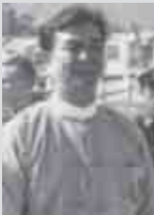
လံးလိခမ်