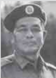
ပူဝ်၊လံးစမ်း