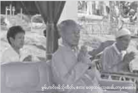
မွမ်, လမ်းဗိသိုတ်, ဧလး ပေးထမ်းသုဆမ်, တျ, ဧမးကံး