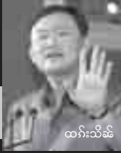
ထက်းသိမ်