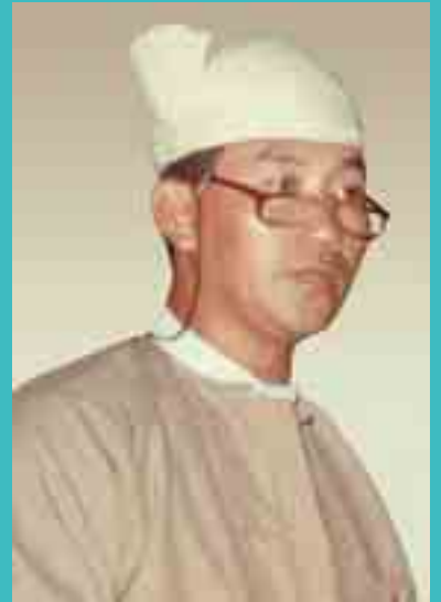
ဗဟိုအဖွဲ့ဝင်၊ ရှမ်းပင်ဂုမ်လှိုင်လက်၊ မာအိ၊ NC မှိုဝ်း 1993