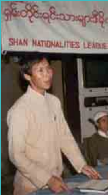
လမ်းညွှန်၊ ပုဂံရွာ၊ မှိုဝ်းစစ်၊ ရှမ်းပင်ဂုမ်လှိုင်လက်၊ မာအိ၊ NC မှိုဝ်း 1993