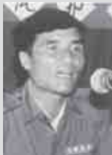
သီဝမ်းမိခမ်၊လိုင်