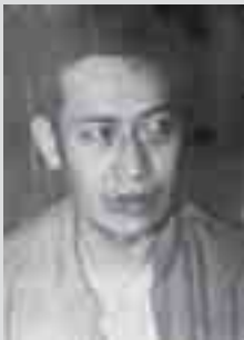
ဂူလုင်းသီဝ်၊ဂင်း