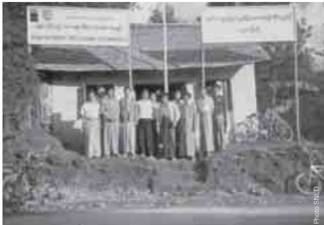
ကိင်ဆိုဝ်လဝ်းဂုတ်းဂေး.ဂိုတ်းဂုတ်ကမ်း,ဂုတ်းဂုတ်းစာတ်းဂိုတ်း ယွဆုံလဝ်းဆေးတီးမာမ်းလွတ်,ငိုတ်းစလး ဂုတ်းဆုမ်,လုတ်းလုမ်း SNLD စပ်ဂုတ်းဂိုတ်းကမ်းဂေး,သားလုမ်းမို, တီးကွင်လိဆိပပ်, ဝါဆိးသုဆိတံဆိ (ပွတ် 3) ပိင်းဂိုင်းတင် လင်,လံးပိုတ်,လုမ်းမို, (ဝံးပင်လိုဝ်းဂုတ်းဂေးပုတ်,ဆွဲးယုင်း NLD)

ဆွဲး 23 ဂေးဆံ. လု 7 ဂေး၊ တိုက်.ပိဆိ MP 7 ဂေး (တူဂ်းစွဲး 1 ထုတ်၊တိးလွဲ.ကွတ်၊ 3 ဂိုတ်း 3)၊ လံးထုတ်၊တံးသုဆိး 9 ဂေး။