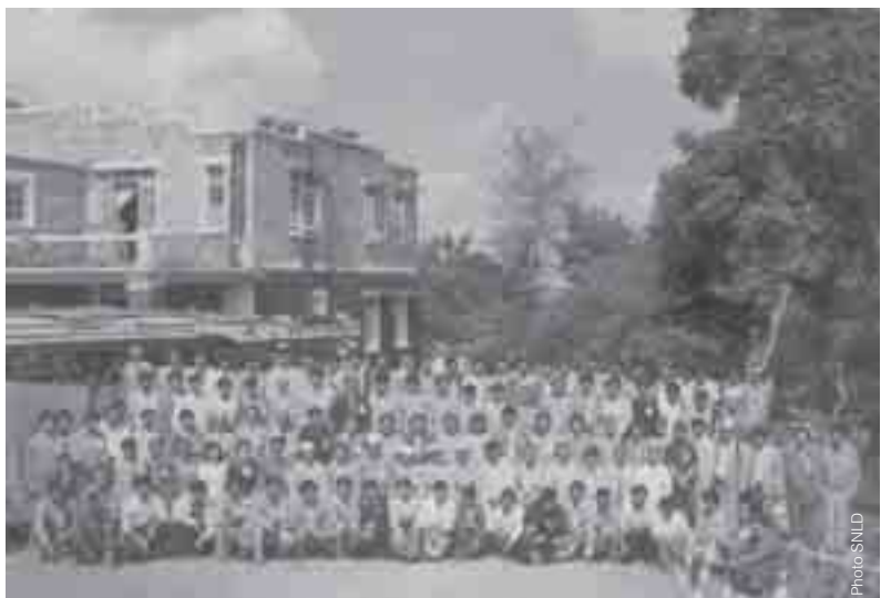
ပၢင်ဂုမ်လုင်ငဝ်းငုမ်းတံးမုတ်းစုတ်းသီဇးလိုင်စိုတ်းတံး SNLD တီ၊ တူခ်းတီ

“ပီခ်းရှိုတ်းဂျေယဝ် ပီခ်းဂဝ်ဂျေယု၊ ပီခ်းရှိုတ်းရှိုတ်းရှိုတ်းဂျေ၊ ဂျေ၊ ဝိုခ်းပိုခ်း ဗုတ်းဗုတ်း၊ ဆမ်လံတ်းဗုတ်းဗုတ်း၊ ရှိုတ်းရှိုတ်းဆေးဂိုတ်းဗုတ်းဆမ်ဂုတ်း။ ပေးတူလုတ်းပိုခ်း သၢဝ်းပီယွမ်းသွင်၊ ထတ်းထွင်ခိုခ်းလိုင် တူဂ်းထိုင်ဝခ်းဂျေ၊ တင်း လုမ်းငဝ်းငုမ်းရှင်သိုဝ် စွပ်းစွပ်း၊ 18 ပီတီမ်မိုဝ်း 21/10/2006 လီဇး။”