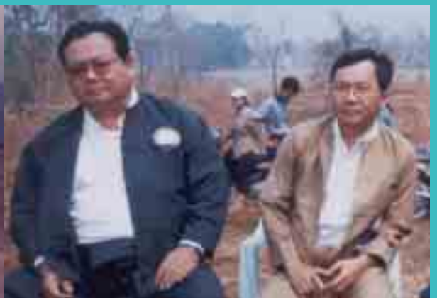
ရှမ်းပင်ဂုမ်လှိုင်လက်၊ မာအိ၊ NC မှိုဝ်း 1993