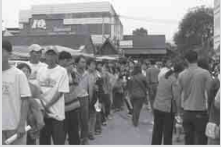
ရှိုင်းဂခမ်းခမ်းမိုင်း ကခမ်းဂု၊တခင်းပုရှိုတ်းဂခမ်း တီးဂိမ်းမံ၊