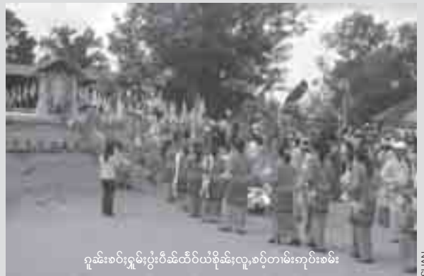
ဂူးခမ်းစမ်းဂူးပွဲ, သီင်ဝ်ယံခိုဆ်, လူ, စပွဲတမ်းကုမ်းစမ်း