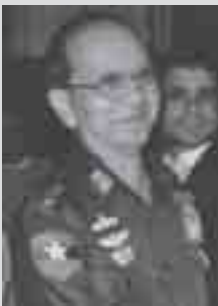
တိုင်းသိုင်၊

တူဝ်တံခမ်းလုမ်းသိုက်မာမ်း၊ လွမ်သိုက် တိုင်းသိုင်၊လၢတ်းဝါး- သိုက်မာမ်းဂေးစွံးပိုက်၊ ပခမ်ခိုခင်းယူ၊ ဂူလုင်းဂါးတပုံသိုက်ဝါး (UWSA) တက်လံးယွမ်းဂွပ်ပခမ်သိုက်မာမ်းပူဂါးတင်း၊ 3 ဂွင်၊ဂၢမ်း ဆဲးဆဲးလိခမ်ပင်သင်း၊ မိုင်းဆင်၊ လုမ်းမိုင်းလုး-