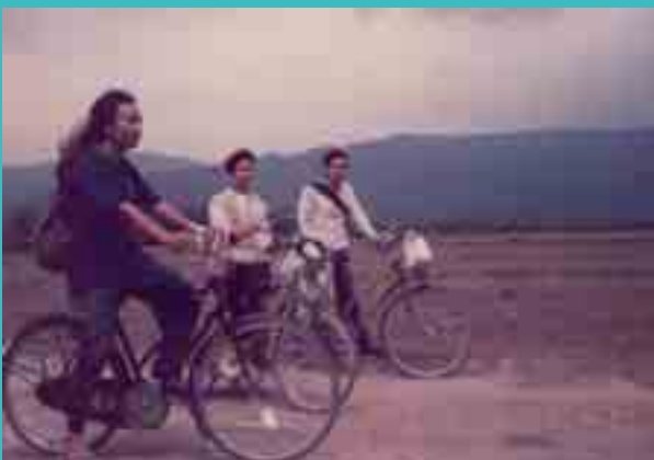
ရှမ်းပင်ဂုမ်လှိုင်လက်၊ မာအိ၊ NC မှိုဝ်း 1993