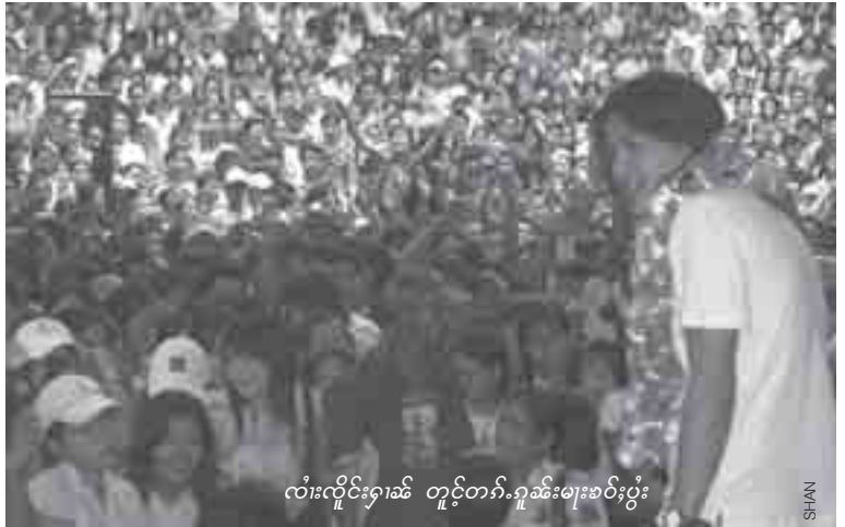
လံးလိုင်းရှၢဆိ တူဝ်တၢ်.ဂုမ်းမးစဝ်းပွဲး

ဆဲးပၢင်းပွဲးဆဲ လဝ်းဆးတီးရှိုင်းဂၢၤဆဲဖူး, လတ်းဂုးဂၢၤဆဲစလးပံးယူ,လီဂေၤ ဂုး,တၢ်းသုမံ ပွဲ.ပဆဲတၢ်းရှို.တီးရှိုင်းဂၢၤဆဲစမးမိုင်းလၢဝ်းတံး ဂိုဝ်,ဂဝ်းဖူး,ရှိုင်းဂၢၤဆဲစလးပံးယူ,လီဆဲ,ဂဝ်,။ လိုဝ်သေဆဲဆဲမီးပုးစဝ်းဖေဂ်းတံး ဂးစဆဲထုဂ်, စံဝါဆဲ, 10 ဝါတံ,။