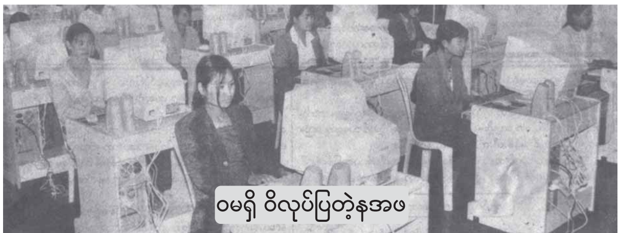
ဝမရှိ ဝိလုပ်ပြတဲ့နအဖ

သျှမ်းရိုးမက နန်းမိုးမခ ခေတ္တ-ဗန်ကောက်။ ဇူလိုင် ၂၅၊ ၂၀၀၆။