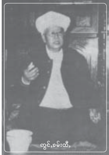
ကွင်၊ခမ်းထီ၊

ပူ၊ဂူင်၊ခမ်ပွခ်း ခိုခ်းလေးဝ်းဝ်းမုဂ်၊မံ၊ ကူင်၊ဂူပ်ဆမ် မီးဂူင်းတု၊ခ်းယု၊ 2 ဂူင်း၊ ဂူင်းခိုင်းမီးလီင်၊လားခိုခ်းတု၊ခ်းဝ်းမုဂ်၊မံ၊ လပ်းခွင်လူင်၊ ဂျပ်၊ဂိုပ်၊ ကျ၊ယု 38 ပီ ပီခ်းစခ်း ဂူပ်ဂင် (ကွခ်တင်းယု၊မိုင်းခမ်း) မိုင်းလီင် ယု၊ပွဂ်းပေးမု၊ (ပေးမု၊) ဝ်းတု၊ခ်းတီး။ ဂိုတ်းမားတင်းစတု၊ပီ 2001 မခ်းလံးမီးဂူင်း သီစပ်း (လမ်းတမ်စပ်း) ယု၊တီးဝမ်းဂူပ်ဆမ် သေ ဂိုတ်းဆေးတိုက်းပွံးယု၊။ ထီင်ဂူင်းခိုင်းသမ် လပ်းခွင်လူင်၊ ဂျပ်းတု၊ဂူပ် ပီခ်းစခ်းဂူပ်ဂင် ကျ၊ယု 47 ပီ စတု၊ဂိုတ်းပီ 2005 (ပီခ်းဂူင်း ဂိုတ်းယု၊ခပ်) ဆမ်ယု၊မေးမီး တေး၊မားတီး ဝ်းတု၊ခ်းတီး စလ၊ဝ်းလီင်၊။ လွင်းဂူင်းယု၊ 2 ဂူင်းခိုခ်းလူမ်းသိုက်းမခ်းစပ်းလီ၊ယု၊ ဂူင်းဂု၊ ကပ်းခိုခ်းယိုတ်းမုခ်းစလ၊ ဂူ၊ယု၊ဂေးဂိုတ်းဂိုင်း ကမ်၊ဂူခ်းခိုခ်းယဝ်။