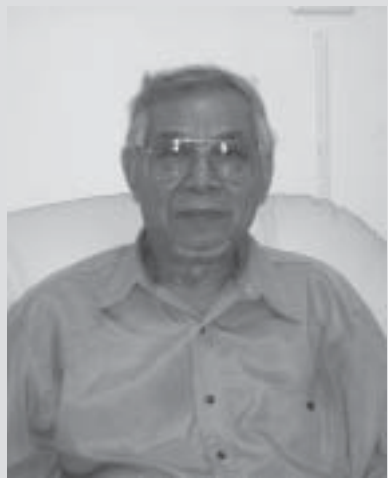
ဗွင်းလိုင်ဗွဲးဆွဲးမိုင်း လပ်းစုဆဲရှမ်း၊

18.9.04 ပင်ဂုမ်လူင်ဂွမ်းမိုင်း ပွတ်း ဆမ်လင်မီးဗုးစိုဆဲးမွဂ်၊ 200 ကုပ်၊ဂမ် တု၊ဂေး၊တင်းလူင်ပွင်လိုင်။ ကာဆဲးကပ် လပ်း သိုပ်ရှမ်းမိုင်းပွဆဲ ပီဆဲလွမ်လိုင်သေတု၊ ဂူပ် ကမ်၊ရှပ်းလုး စိုဆဲးလိုင်၊ လပ်းသိုပ်စာမ်၊ဗုး- ပီဆဲလွမ်လိုင်။