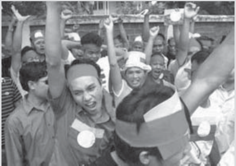
ပီးဆွဲးတံးလိုင်မားမီးမိုင်းထံး စဆဲဂင်လှဲတု၊ယွမ်းမာမ်၊ ရှပ်းပမ်ဂွမ်းခေးမိုင်းတံး စလး ဂမ္မံထီမ်လူင်ပွင်လိုင်တံးပိုဆဲဗေင်၊ဂွမ်းခေး (ဆေးလုမ်းဗွင်းတင်မာမ်၊ တီးမိုင်းဂွဂ်၊ မိုင်းထံး)

တင်းစတု၊ဂင်ပီ 2005 မား သိုက်မာမ်၊ တိုက်စာမ်၊ဂွမ်းမိုင်းဆဲးမိုင်းတံးပွတ်းဂင်/လားဆဲး ပိုဆဲဗေင်၊သာဆဲးစတ်းလုမ်း လူင်ပွင်လိုင်တံး လုပ်းယာမ်။ ဝံးဆဆဲကမ်၊ရှိုင် မာမ်၊သုင်၊ရှိုင် သိုက်ဆပ်းရှပ်းရှပ်း စပ်းတပ်းပိုဆဲတီးတပ်းလုမ်း 758 ကမ်၊ဂမ္မံထီမ်လူင်ပွင်လိုင်၊ရှပ်းရှပ်း။