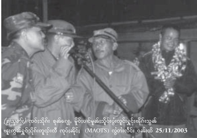
(စုခ်ဂျေ့) လဝ်းသိုက် စုခ်ဂျေ့, မိုဝ်းပင်မုခ်ဂျေ့;သိုက်ပွဲးလုင်းရှမ်းဖိုက်းသွမ်း ဖူးကွမ်းရှမ်းသိုက်ကုလ်းလီ လုက်;ဆိုင်; (MAOTS) လွံတံးလိင်း ဝမ်းထိ 25/11/2003

လဝ်းစုခ်ဂျေ့,စပ်တင်း 32 ဂေ့. လံးစုခ်ဂျေ့လုမ်းတြး ထွမ်,ဖူးတတ်းသိမ် ကမ်း,စဆေးပေးပိုင်တတ်းသိမ်။ဆွဲးလုမ်းဆွဲးလိုင်သေဖူးတတ်းသိမ်။ ဖူးတင်ဆေး ကမ်းလဝ်းဆေးတီးစပ်လိုင်ဂုမ်းပမ်း ဖူးဂုမ်းစွက်ဂိတ်,လဝ်းဆေးတီးစွက်;စင်လံါလံါဂေ့.ဆွဲး ကမ်,မီးဂုမ်းတင်းဆွဲးစပ်;ဂျေ့,ထွမ်,လုမ်းလံးသေဂေ့။ လဝ်းစုခ်ဂျေ့,စလးထိုင် 28 ဂေ့.၊ ရှမ်း 29 ဂေ့.လုးတမ်း,တံါဂုမ်းဂေ့။ တုတ်လဝ်းစုခ်ဂျေ့,ဂေ့.လိပ်လုးတမ်း,တံါလံါ 5 စေး(5 တုတ်ဆိပ်), လွမ်းဆင်,စေးမံါ (မာတ်တဂုး) 19-ဂ,22-စ,21,15,2,61,122, 124,241။ ဆွဲး 9 စေးမံါဆွဲး လိုင်သေစေးမံါ 61 စလး 241 ဆွဲး ပိမ်းတမ်း,တံါဂုးစေးတင်းမုတ်။ သိုက်ရှမ်းဖူးမီးလဆွဲး ပုးတုးလဝ်းစုခ်ဂျေ့, 31 ဂေ့.ဆမ် မီး 3 ဂေ့. လိုင်းကျ,ယုလိက်လုးတမ်း,စွက်; 7 ပိ လံးတုက်;စွက်;တီးလုးသိုက်။ ပေးဝုးတတ်းသိမ်ပမ်းတမ်း,တံါသေ ပုတ်းပင်လုမ်းတြးယပ်ဂေ့;ကပ်စပ် 29 ဂေ့. တင်,ဂုးစွက်;လုင်းဂျေ့,စင်ပိုတ်; စွက်;လိုင်ဝိင်းလိုင်,ကမ်းမီးဆွဲးစုးဝိင်းဂပ်, ဝမ်းဆမ်ဂမ်းလိပ် ဆမ်ယပ်။