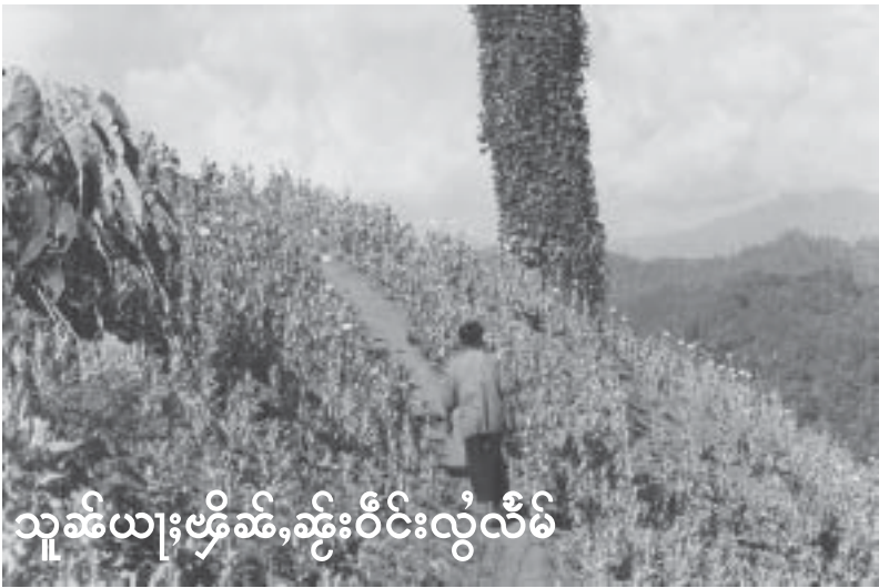
သူခမ်းယုဒအိမ်၊ ဆွေးနွေးရန် လှိုင်လိမ်

ခင်းရှိတ်သူခမ်းယုဒအိမ်၊ 3-4 လှိုင် တင်းစတုရန်း၊ တေး၊ လှိုင်လှိုင်ကပ်လှိုင်ဆွဲသမိုင်း ပူဆွဲမုဒ်ဆွဲ မုဒ်ကပ်၊ မုဒ်လင်း လှိုင်သင်၊ တင်းဂပ်ပိ၊ စပ် တီးဝတ်ပွတ်ကျေး (ကဆွဲရှင်) ဝံလှိုင်လိမ် ရှိတ်ကမ်းရှိတ်သူခမ်းယုဒအိမ်၊ ဖုန်း၊ လှိုင်လှိုင်ဝင်းဝတ် တင်းရှင်မွှက်၊ 1 တိုင်။