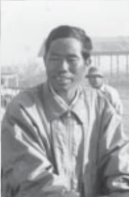
မထူးနေနီ