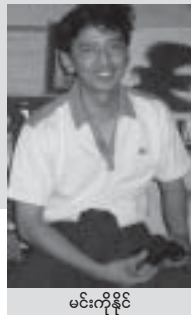
မင်းကိုနိုင်