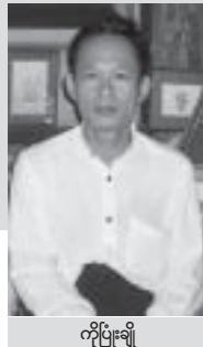
ကိုပြုံးချို