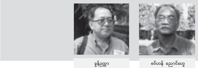
ခွန်ဥက္ကဋ္ဌ