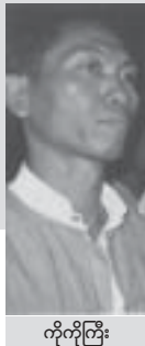
ကိုကိုကြီး

ကျောင်းသားများရဲ့ ခံယူချက်သဘောထား၊ နိုင်ငံတကာကျောင်းသားများရဲ့ ရပ်တည်ချက်တွေကို လေ့လာကြည့်တော့ ဝေဖန်သူများက ကျောင်းသားဆိုတာလက်ဝဲဝါဒသမား တိုက်ခိုက်ရေးသဘောထားရှိသူများလို မြင်ကြတာရှိပါတယ်။ စာရေးသူအမြင်မှာတော့ ကျောင်းသားဆိုတာ လက်ဝဲလက်ကျာဝါဒရယ်လို မရှိပါဘူး။ တိုက်ခိုက်ရေးသဘောထားတော့ရှိပါတယ်။ လက်ဝဲဝါဒ ကျင့်သုံးတဲ့ နိုင်ငံမှာ ကျောင်းသားတွေ လှုပ်ရှားတိုက်ပွဲဝင်ကြပါတယ်။ လက်ျာဝါဒကျင့်သုံးတဲ့နိုင်ငံမှာလည်း ကျောင်းသားတွေလှုပ်ရှား တိုက်ပွဲဝင်ကြပါတယ်။ လက်ျာဝါဒကျင့်သုံးတဲ့နိုင်ငံမှာလည်း ကျောင်းသားတွေလှုပ်ရှား တိုက်ပွဲဝင်ကြပါတယ်။ ဘယ်ဝါဒကျင့်သုံးတဲ့အစိုးရမဆို မိဘပြည်သူလူထုအကျိုးစီးပွားကို ပျက်စီးကြောင်းပြုခြင်း၊ ဖိနှိပ်အနိုင်ကျင့်ခြင်း၊ မတရားတဲ့ဥပဒေတွေပြုခြင်း၊ အုပ်ချုပ်ခြင်း၊ တရားစီရင်ခြင်းများပြုလာရင် မိဘ ပြည်သူရဲ့ သားသမီးပီသစွာ ခိုင်းလွှားသဖွယ် ကာကွယ်ခြင်းနဲ့ ရှေ့တန်းတက် တိုက်ပွဲဝင်ခြင်းများ လုပ်ဆောင်ကြပါတယ်။ နိုင်ငံ တကာလူ့အဖွဲ့အစည်း ပြောင်းလဲတိုးတက်လာတဲ့ ဖြစ်စဉ်တလျှောက်မှာ ကျောင်းသားများရဲ့ တောက်တောက်ပြောင်ပြောင်တိုက်ပွဲဝင်ခဲ့ အခန်းကဏ္ဍဟာအထင်အရှားဖြစ်ပါတယ်။ အထူးသဖြင့် နယ်ချဲ့ဆန့်ကျင်ရေးနဲ့ ဖက်ဆစ်ဆန့်ကျင်ရေးတိုက်ပွဲတွေမှာ ကျောင်းသားတွေ ရှေ့တန်းကနေ တိုက်ပွဲဝင်ခဲ့ကြတာပါ။ မတရားဖိနှိပ်သူ ဘယ်အင်အားစုကိုမဆို ဒီနေ့