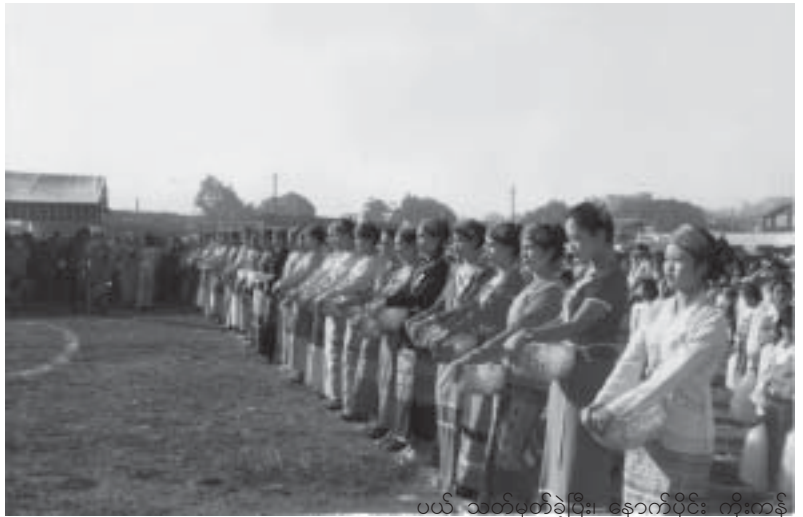
ပယ် သတ်မှတ်ခဲ့ပြီး၊ နောက်ပိုင်း ကိုးကန့်

( Tai )လို့ ခေါ်ဝေါ်သုံးနှုံးပါတယ်။ ဥပမာ တိုင်းယောင်တွေ Tai Yawnghe (ညောင် ရွှေ) တိုင်းမိန်းနိုင် Tai Mongnai (မိုးနဲ)၊ တိုင်းလိုင်ခါ Tai Laikha (လဲချား)၊ တိုင်းကျိုင်းတုံ Tai Kengtung ၊ တိုင်းဆီပေါ Tai Hsipaw (သီပေါ) စသဖြင့် တိုင်းကို ရှေ့ထား ပြီး ဒေသအလိုက်ခေါ်ဝေါ်ကြပါ တယ်။