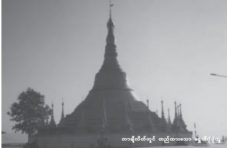
တာချီလိတ်တွင် တည်ထားသော ရွှေထိရုံပုံတူ

လွန်ခဲ့သည့် 23.4.03 ရက်နေ့ကလည်း သျှမ်းပြည်မြောက်ပိုင်း တန့်ယန်းမြို့နယ် မိုင်း တွမ်းအုပ်စု ဝမ်းကတိရွာရှိ ဘုန်းတော်ကြီး ကျောင်းသို့ ခလရ 238 မှ တပ်ဖွဲ့တစ်ဖွဲ့ ရောက်သွား၏။ အထက်လူကြီးများ၏ ညွှန်ကြားချက်ဟုဆိုကာ ကျောင်းဝင်းအတွင်း ရှိကြားမြင့်လှပြီဖြစ်သော ကောင်းမူးတုန်စေတီ ၏ထီးတော်ကို ဖြုတ်ချ၍ ထီးတော်အသစ်တင် ပေးရမည်ဟုပြော၏။ ကျောင်းထိုင်ဘုန်းကြီးနှင့် တကွ ရွာသူကြီးအပါအဝင် သက်ကြီး ရွယ်အို ရွာသူရွာသား များကပိုင်းဝန်း တိုးလျှိုးတောင်း