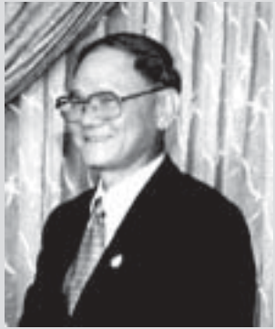
မီးချိုင်းရိုးချူးဖန်း ယခင်အထက်လွတ်တော်ဥက္ကဋ္ဌ

“အစပိုင်းတုံးကတော့ ဝန်ကြီးချုပ်ဟာရာမမင်း ဖြစ်မယ့်ပုံဘဲ။ အရာရာကိုညွှန်ကြားပြီးတော့ တခြားလူတွေကိုသွားလုပ်ခိုင်းတယ်။ လုပ်ရင်းလုပ်ရင်းနဲ့ စိတ်တိုင်းမကျလို့ ဒသဂီရိဆယ်မျက်နှာဖြစ် သွားတယ်။ ဒါပေမဲ့ ဆယ်ခေါင်းဆယ်မျက်နှာစလုံး သွားလုပ်လိုက်တော့ ခေါင်းကိုက်လာတယ်။ နောက်ပိုင်းကျရင် ဝန်ကြီးချုပ် ဟနုမာန် ဖြစ်မဲ့ကိန်းဘဲ။ အားလုံးကို ခိုင်ခံ့လုပ်လိုက်လို့ ညွှန်ကြားလို့ ရတော့မှာမဟုတ်ဘူး။”