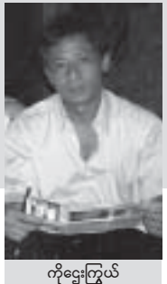
ကိုဌေးကြွယ်