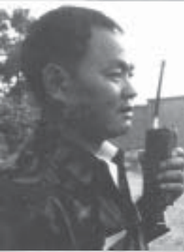
ပေါင်းလူချန်