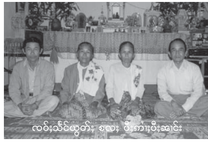
လပ်းသီင်ယွတ်, စလး, ပီး,စားပီး,ဆင်း