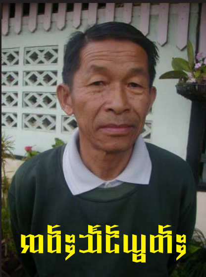
ကမ်,သိုဝ်းသို

လိုဝ်း ကပ်,သိုဝ်းသို (လုဝ်းလုဝ်းသိုဝ်းသို; စမ်းယွတ်); လိုဝ်းမိုဝ်းလီဝ် လံးကုဝ်းမိုဝ်း လိုဝ်းဂျင်း ဘေးပု, ပေးစမ်း လုဝ်းဂျင်း, ဟုဂျင်း, (ပုဂ္ဂိုလ်းဝ်းပိုဝ်းပမ်း, ပေးပိုဝ်းပေးတိုဝ်းတုဝ်း ပမ်းသိုဝ်းလုဝ်းပေးပုဂ္ဂို; 2 စမ်းပိုဝ်းပေးပုဂ္ဂိုလ်း, ဟုဂျင်းလုဝ်းပေး, စလ; လုဂ်းကွမ်, လေးဝ်း (ဂိုဝ်းသုသွမ်းခိုဝ်း/မာဂ်,လုဂ်း/ဂုဂ်း) ပီဂိုဝ်း, 1942 လိုဝ်းခိုဝ်းပိုဝ်း 15 ဝမ်း, ဝမ်းတိုဝ်း တီးဂိုဝ်း, ပုဂ္ဂိုလ်းဝ်း, မိုဝ်းပမ်း, လေးတွမ်ခါ့လုဝ်း ဂိုဝ်းယမ် ပုဂ္ဂိုလ်း ဆမ်ဂတ်ကမ်လီဝ် B.Sc ပီ 3 ပီးဆွင်ဂုဝ်းတွမ် မီး (4) ဂေ့, (လံး 2 ယိုဝ်း 2) 1. လံးလုဝ်း, B.A 2. ဆမ်းခိုဝ်း,ဆု 3. ဆမ်းလုဝ်း 4. လံးကုဝ်းမိုဝ်း (ပီးဆွင်လိုဝ်း) ဆေးဂိုဝ်း ဆမ်းသိုဝ်း, 1972 (ယု,ဝမ်းဂုဝ်းလံးကွမ်, ဂိုဝ်း,ဝမ်းယွတ်;မိုဝ်းယမ်းဝမ်းလုဝ်း လေးဝ်းပိုဝ်းဆွင်) လုဂ်းလမ်း 1. ဆမ်းယွတ်;ဆွမ်း (လု 1996) 2. ဆမ်းသိုဝ်းကွမ်, 3. လံးလိုဝ်းစမ်း (လုဂ်းပုဝ်းစမ်း) 4. လံးယွတ်;ပေး တီးယု, ဆိုဝ်းလုဝ်းလုဝ်း, ဂိုဝ်း,ပိုဝ်းလုဝ်း, လေးဝ်းပိုဝ်း ဝမ်းသိုဝ်းမုမ် 6/1/2005 ဝမ်းဗေး, မိုဝ်းကု,ယု 63