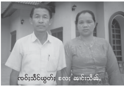
လပ်းသီင်ယွတ်, စလး, ဆင်းသီဆ်,